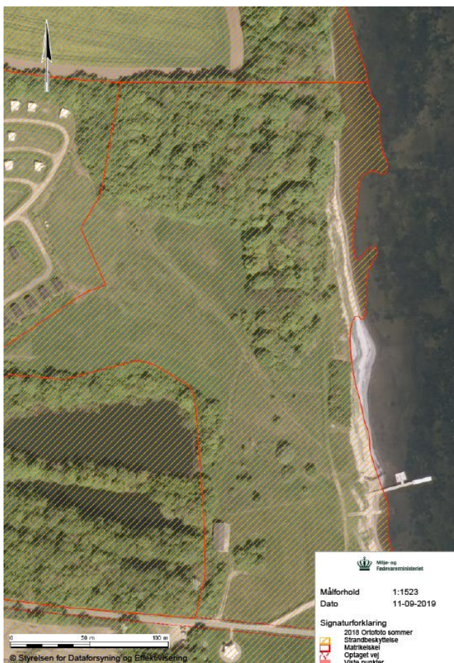
Fig. 1. Oversigtkort af området Marienlyst Strand, hvor der ønskes udendørsfaciliteter. Orange skravering indikerer strandbeskyttelseslinjen.

Placeringen af de enkelte faciliteter ses på fig. 2. Bålfad ønskes placeret ud for bordbænkesæt.