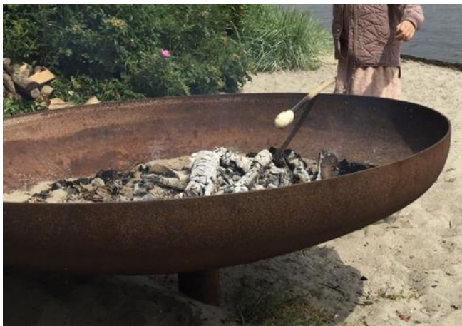
Fig. 5. Billedeksempel på bålfad.

Arealet er omfattet af fredningskendelsen Skive Kystskrænt, og omfattet af lokalplanen 109 Marienlyst Strand.