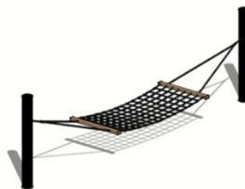
Fig. 3. Billede af et af de eksisterende bordbænkesæt (venstre) og billedeksempel på ønsket hængekøje (højre).