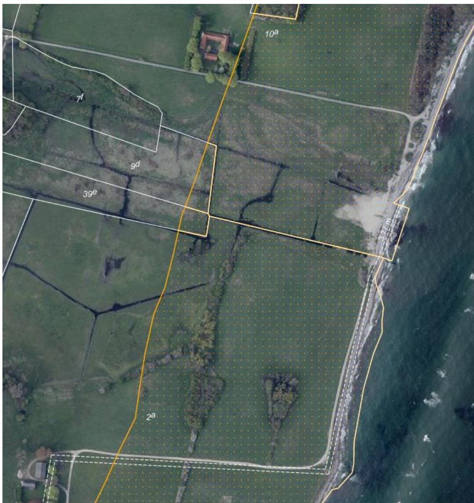
Fig. 1. Ortofoto 2024. Det orangeprykkede område markerer det strandbeskyttede areal. De hvide streger markerer de vejledende matrikelskel. Den delvist borteroderede vej ligger helt ude i strandkanten.