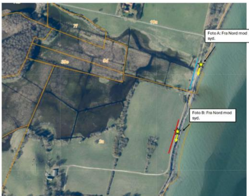
Foto viser strækningen samt placering for foto A & B