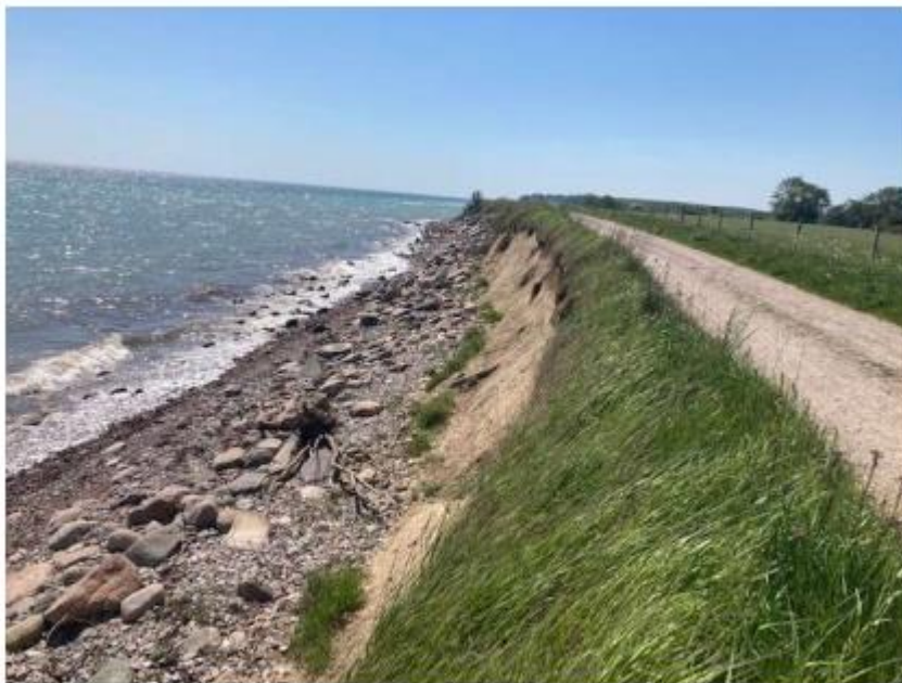
Foto af klint og vejstrækning fra position B mod syd.

I forbindelse med Langeland Kommunes afslag til nedlæggelse af vejen som privat fællesvej er sagen behandlet i kommunalbestyrelsen den 2. april 2024, hvor det bl.a. fremgår af sagsfremstillingen: