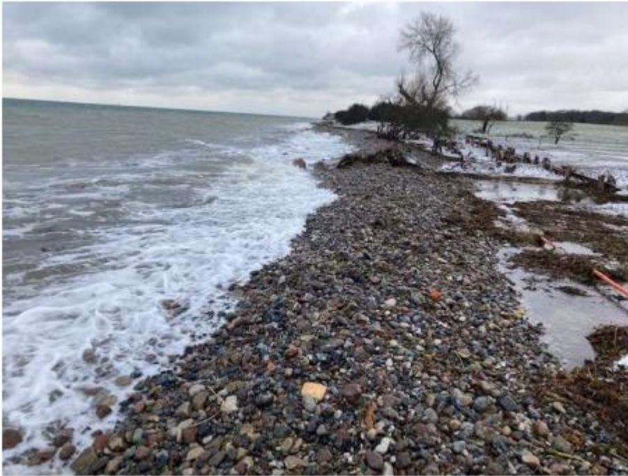
Foto fra position A og viser påvirkningen ved østlig vindretning.