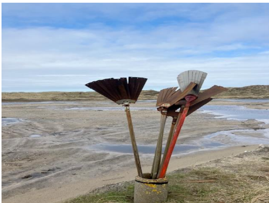
Figur 1: Foto af sprængningsplads. Læg mærke til den markante niveauforskel og oversvømmelserne.

Sprængningspladsen ønskes reetableret med ca. 1 m. sand således, at pladsen kommer i niveau med det omkringliggende terræn og dermed ikke oversvømmes i perioder med regn, jf. figur 1.