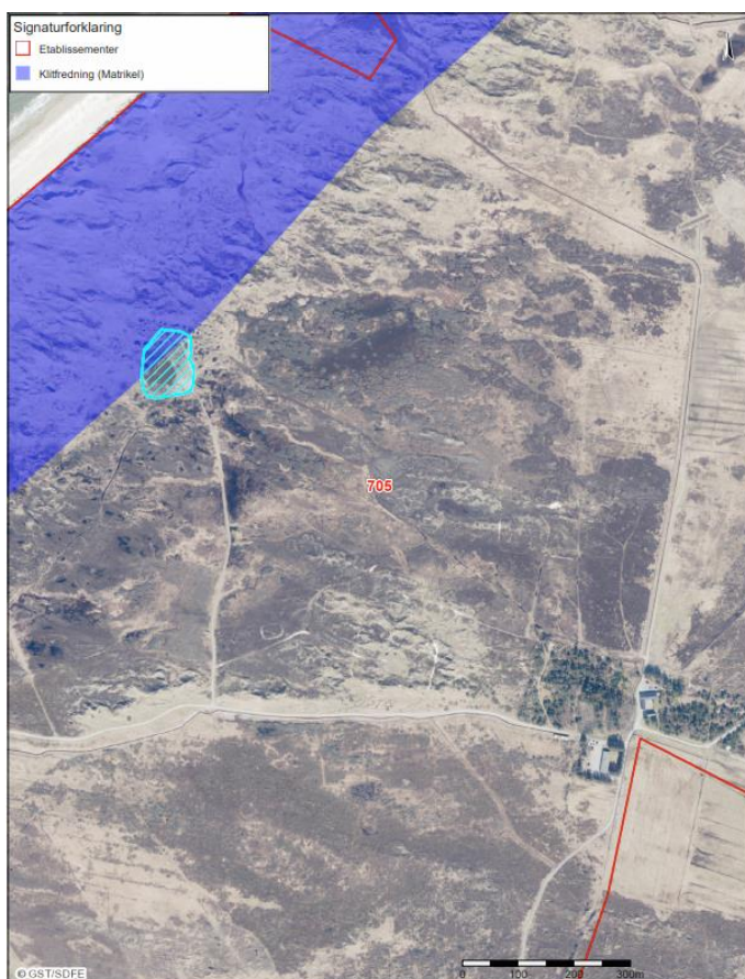
Figur 3: Kort visende at ca. 1/3 af sprængningspladsen er underlagt

Sprængningspladsen på Tranum Skydeområde gennemskæres af Kystfredningslinjen, jf. figur 3.