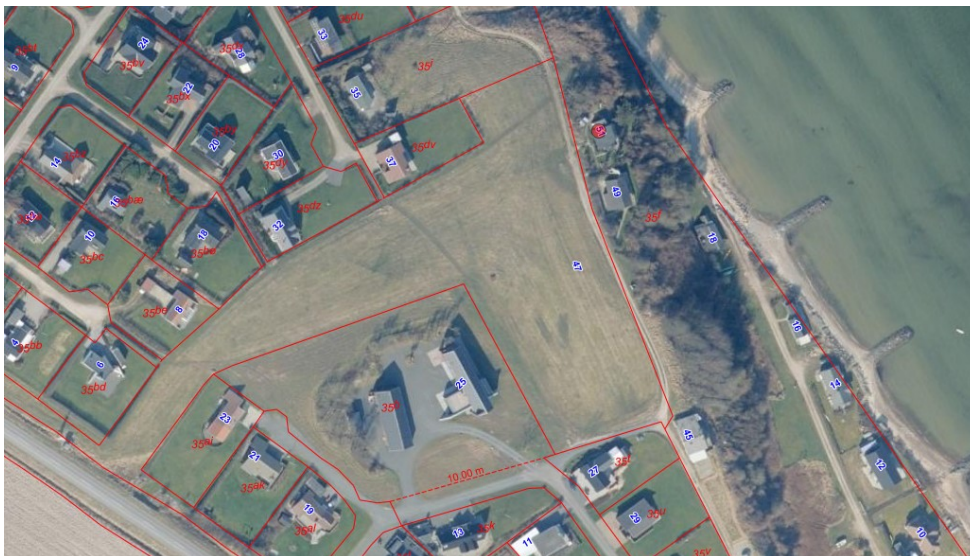
Ejendommen ligger ved rød prik