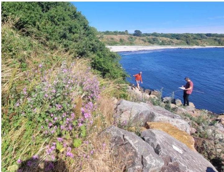
Terræn hvor trappe placeres