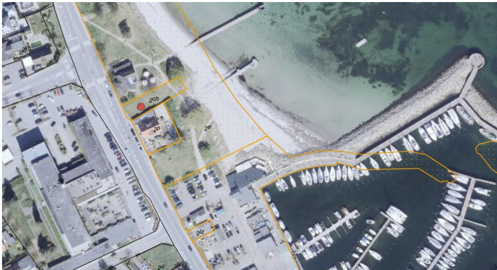
Figur 1. Ortofoto 2025. Den røde prik markerer matrikel 2ch Vedbæk By, Vedbæk. Det strandbeskyttede areal er markeret med orange signatur (umatrikulerede arealer ud til kysten samt stranden er dog også omfattet af bestemmelserne om strandbeskyttelse). De sorte og orange streger markerer de vejledende matrikelskel.