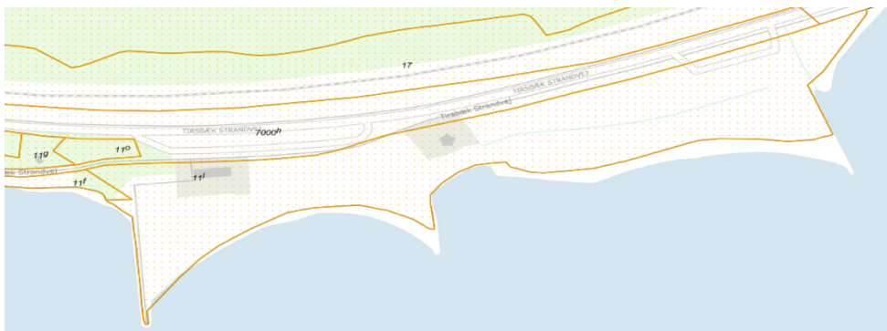
Fig. 1. Området ved Albuen Strand. Ortofoto 2021. Det orange prikkede område markerer det strandbeskyttede areal. De orange streger markerer de vejledende matrikelskel.

Alle 3 matrikler er helt omfattet af strandbeskyttelse. Se figur 1, 1.1 og 1.2.