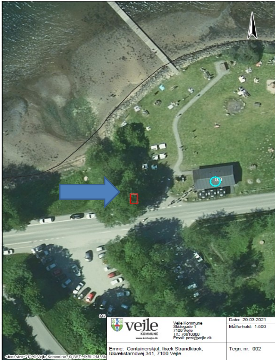
Fig. 3.1. Containerskjul, Ilbæk Strandkiosk, Ilbæk Strandvej 341, 7100 Vejle, opstilles ved rød firkant markeret med blå pil