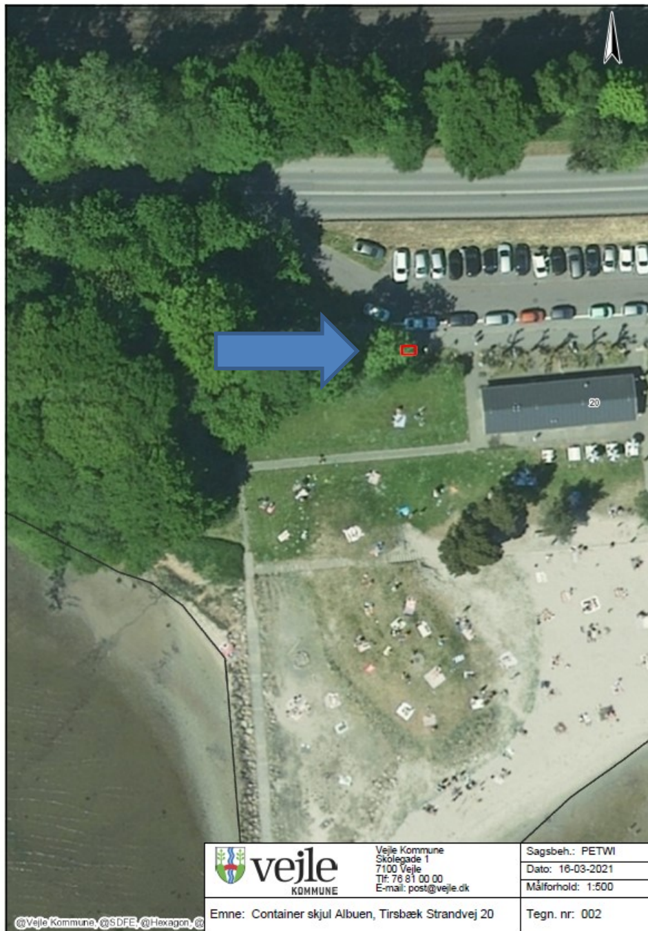
Fig.3 Container skjul Albuen, Tirsbæk Strandvej 20, 7100 Vejle opstilles ved rød firkant markeret med blå pil