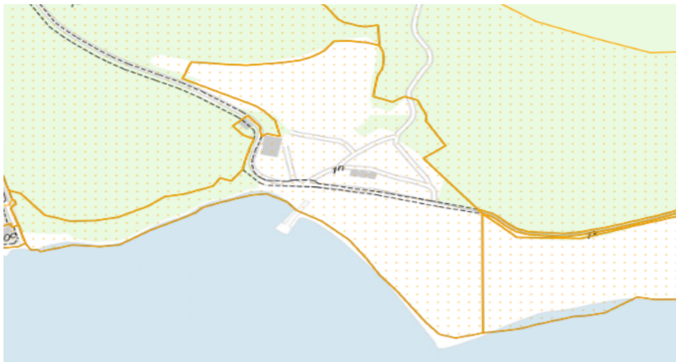
Fig.1.1 Området ved Tirsbæk Strandkiosk. Ortofoto 2021. Det orange prikkede område markerer det strandbeskyttede areal. De orange streger markerer de vejledende matrikelskel.