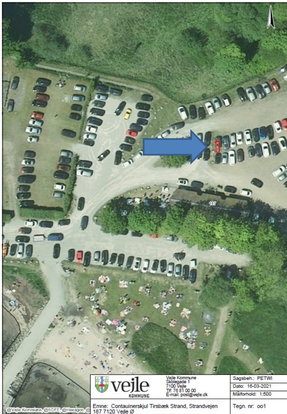
Fig.3.1 Containerskjul Tirsbæk Strand, Strandvejen 187, 7120 Vejle Ø, opstilles ved rød firkant markeret med blå pil

Matrikel 48a Andkær By, Gauerslund (Ilbæk Strand) er beliggende i noteret værdifuldt landskab og lige vest for den ønskede placering af container ved Ilbæk Strandkiosk er der registreret et §3-beskyttet vandløb jf. naturbeskyttelsesloven. samt Containeren ved Albuen ligger i Natur- og Vildreservat Vejle Inderfjord. På matr. nr. 1n Tirsbæk Hgd., Engum (Tirsbæk Strand) er der jf.