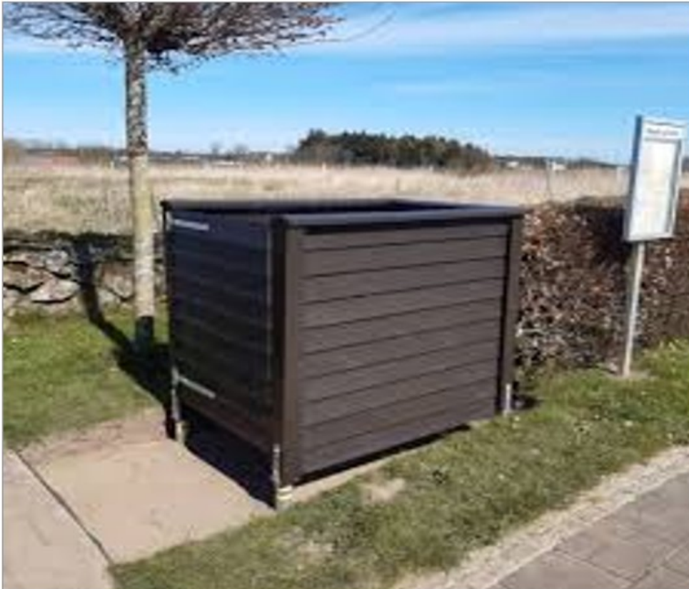
Fig. 2. Eksempel på containerskjul jf. ansøgning

Det er oplyst at containerne flyttes min. 5 meter væk fra nuværende placering direkte op af kioskbbygninger på baggrund af kommunens risikovurdering af brandtekniske årsager.