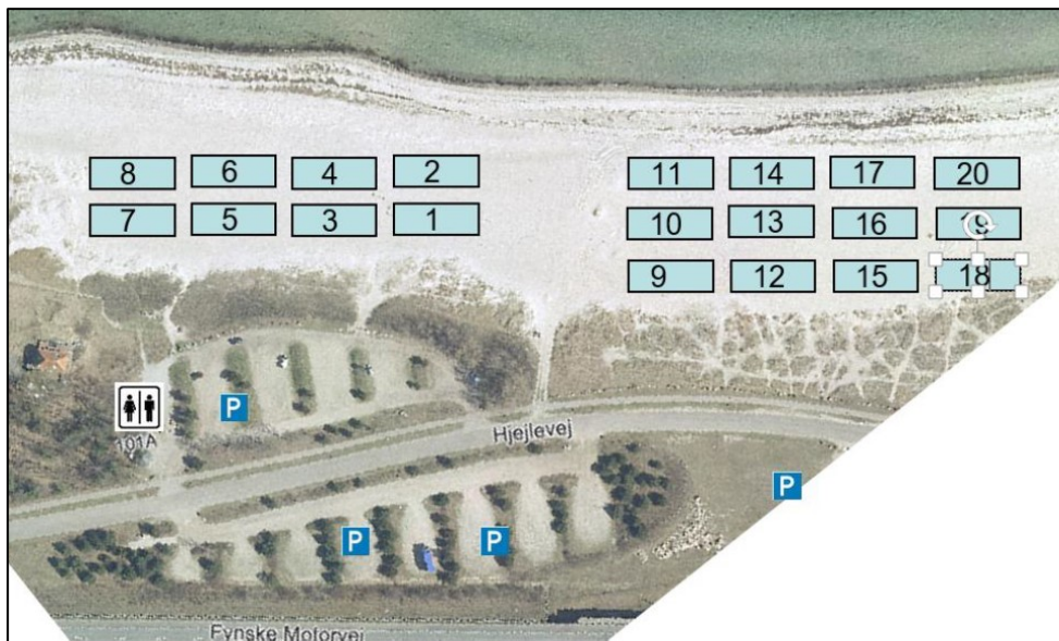
Situationsplan for banerne. Eventuelle ekstra baner inden for rammerne af denne tilladelse vil blive tilføjet mod øst/Storebæltsbroen.