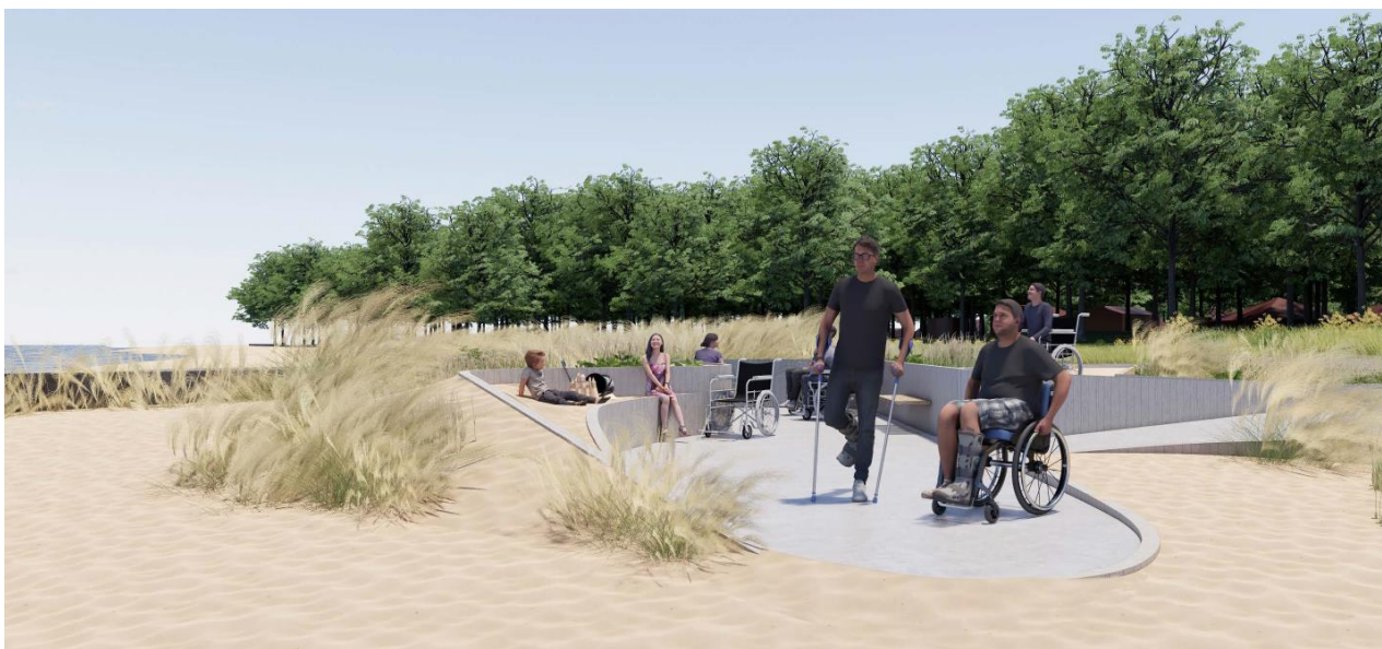
Fig. 10. Tilsendt fra ansøger. På figuren ses en illustration af anlægget set fra stranden (nord mod syd) med broen i baggrunden.