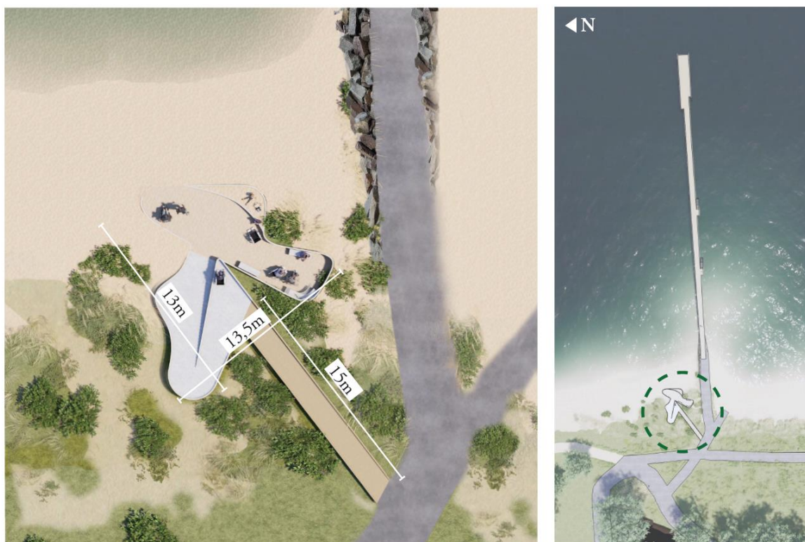
Fig. 3. Tilsendt fra ansøger. På figuren ses illustrationer af den ansøgte placering af anlægget.