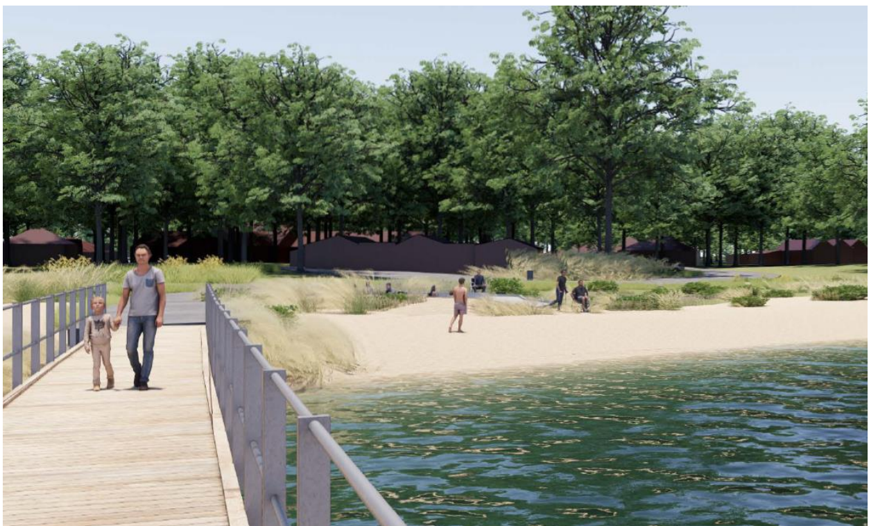
Fig. 9. Tilsendt fra ansøger. På figuren se en illustration af anlægget set fra broen.