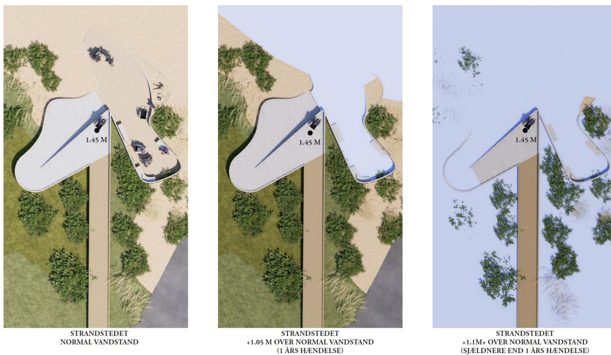
Fig. 6. Tilsendt fra ansøger. På figuren ses illustrationer af anlægget ved forskellig vandstand.