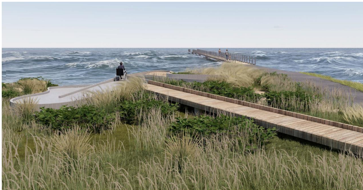
Fig. 7. Tilsendt fra ansøger. På figuren ses en illustration af anlægget set fra ankomstpunktet ved den eksisterende sti.