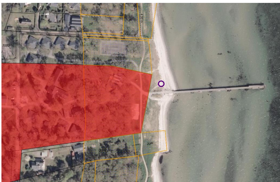
Fig. 2. Ortofoto 2025. Det strandbeskyttede areal er markeret med orange signatur. De umatrikulerede arealer ud til kysten samt stranden er dog også omfattet af bestemmelserne om strandbeskyttelse. De sorte streger markerer de vejledende matrikelskel. Det røde område markerer den ansøgte matrikel. Den lille cirkel markerer den ansøgte placering af anlægget. På figuren ses også en kystnær sti i nord/sydgående retning. Stien forbinder Hou Havn, ca. 881 m mod syd, med Hou Strand Camping, ca. 450 m mod nord. Stien er kørestolesejnet.