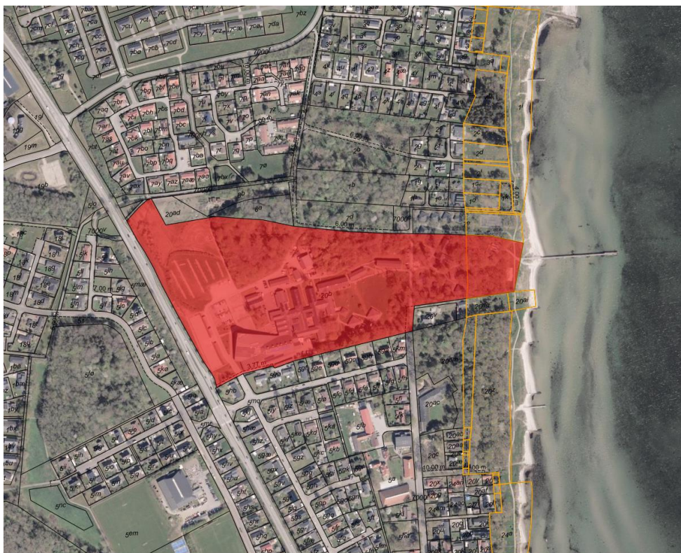
Fig. 1. Ortofoto 2025. Det strandbeskyttede areal er markeret med orange signatur. De sorte streger markerer de vejledende matrikelskel. Det røde område markerer den ansøgte matrikel.

Illustrationer af anlægget ses på figur 3 - 10.