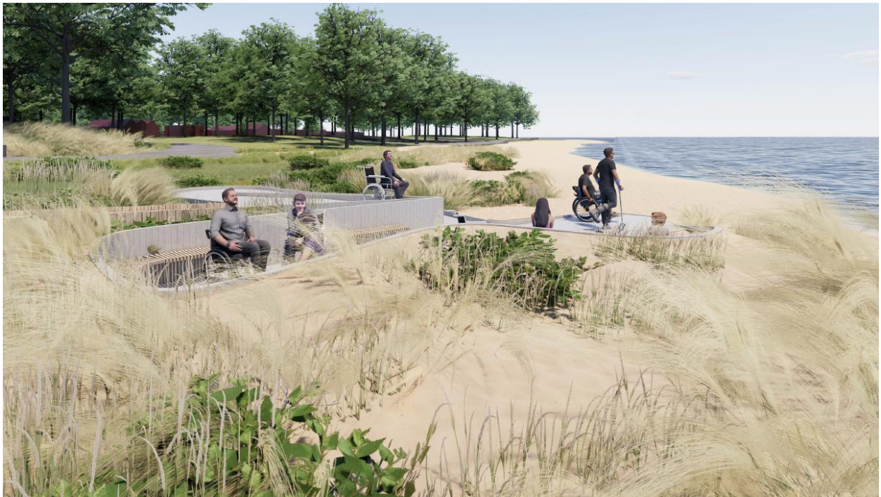
Fig. 8. På figuren ses en illustration af anlægget set fra broen mod nord.