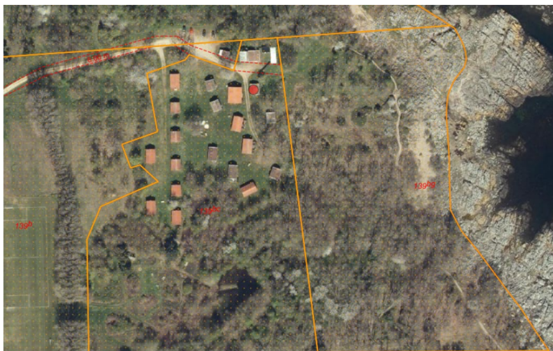
Fig. 1. Ortofoto 2025. Det strandbeskyttede areal er markeret med orange signatur. De røde streger markerer de vejledende matrikelskel.

Sommerhusene ligger desuden inden for fortidsminde kulturarvsareal, men uden for fortidsminde beskyttelseslinjer.