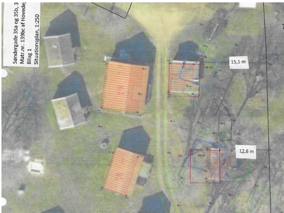
Fig. 2. Ansøgt placering vist med rød streg. Øverste hus nr. 35a, (hus 1) uændret placering og nederst hus nr. 35b, (hus 2) flyttes 3,4 m landværts mod vest.