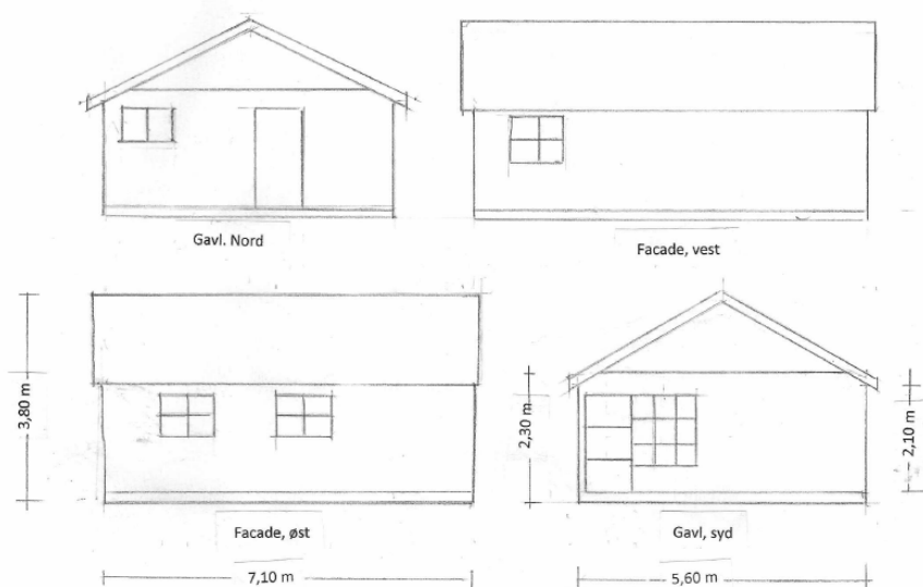
Fig. 4. Fra ansøgningen, viser facadeplan for de genopførte huse.

Der er ansøgt om genopførelse og udvidelse af de 2 sommerhuse med ca. 8 m 2 til forbedring af de sanitære forhold og til krav om øget isolering, således der søges om en samlet udvidelse fra ca. 30 m 2 til 39,7 m 2 .