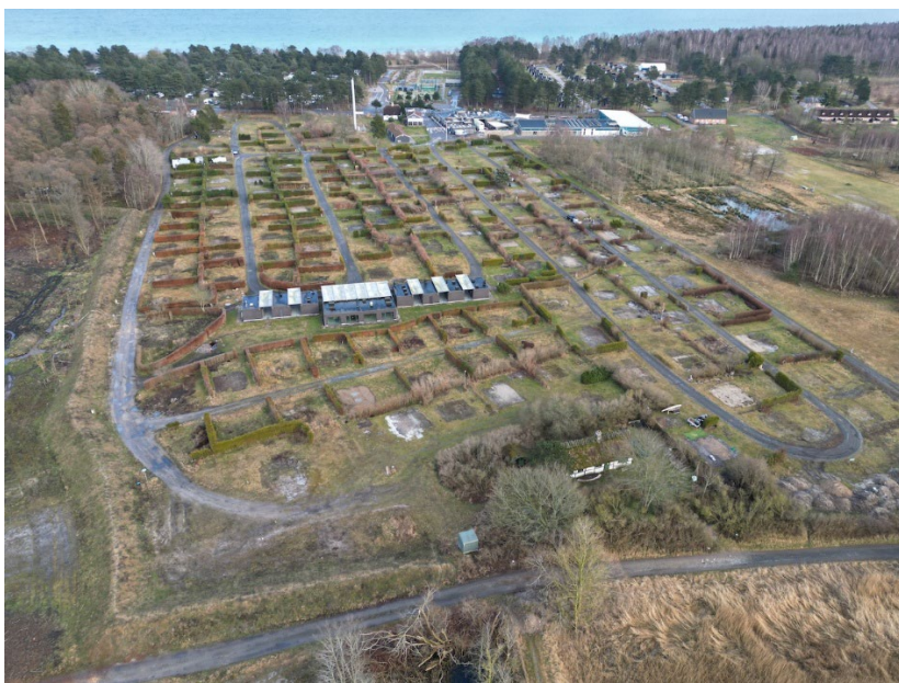
Foto af tidligere forhold set fra vest. Indsendt af ansøger.