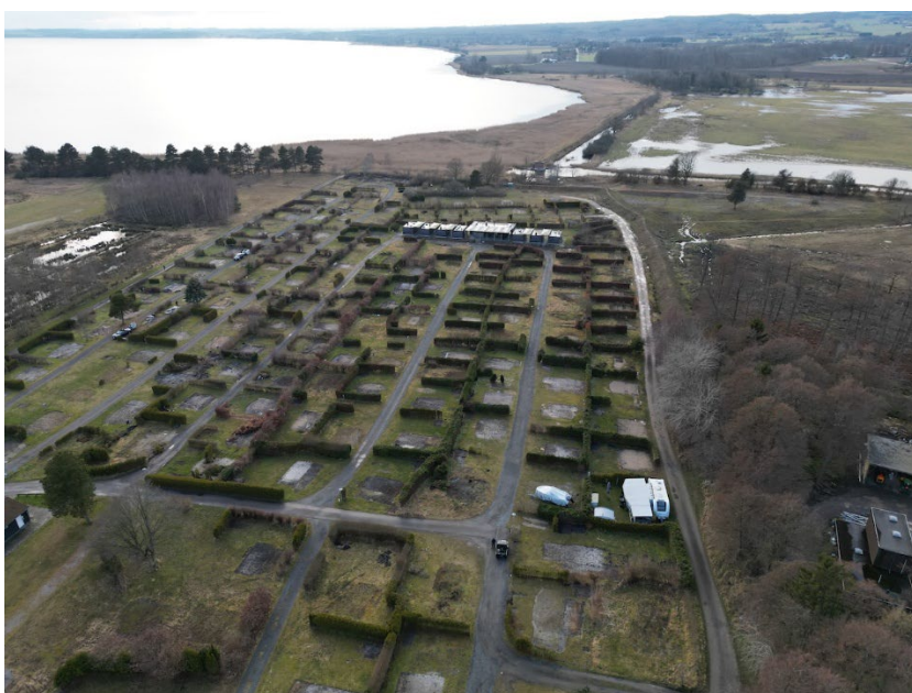
Foto af tidligere forhold set fra øst. Indsendt af ansøger.