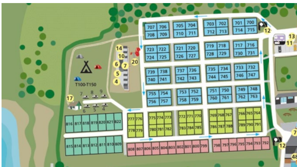
Pladskort viser nyt layout.