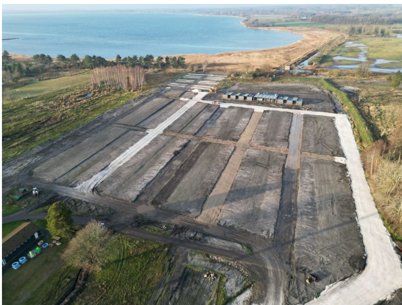
Nyt layout. Foto fra øst indsendt af ansøger.