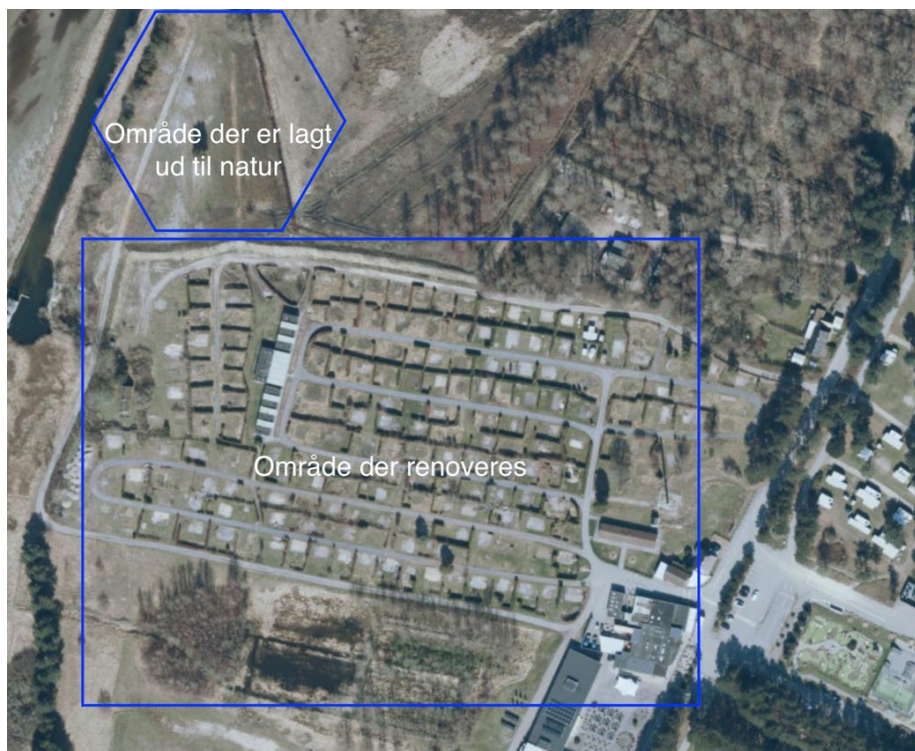
Situationsplan indsendt af ansøger.