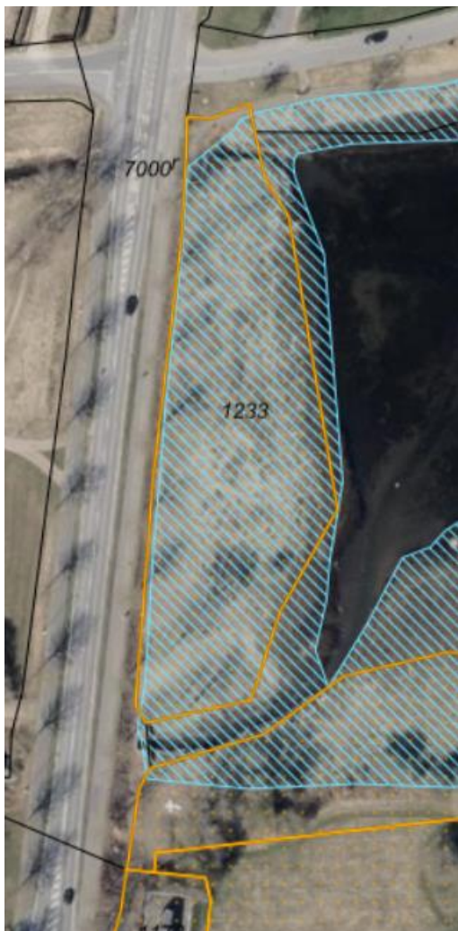
Fig. 1. Ortofoto 2025. Matr.nr. 1233, Gråsten, Gråsten-Adsbøl. Det strandbeskyttede areal er markeret med orange signatur. De sorte streger markerer de vejledende matrikelskel. Det lyseblå skraverede område markerer beskyttet natur – strandeng - efter naturbeskyttelseslovens § 3.

Det fremgår blandt andet af ansøgningen: