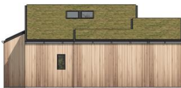
facade mod øst