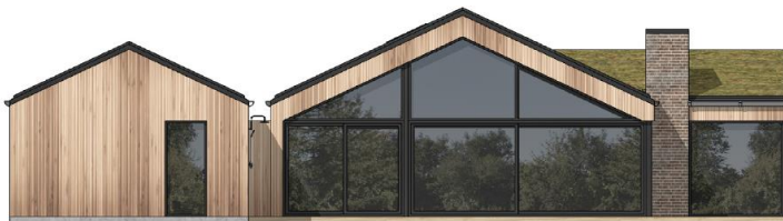
Nordfacaden før og efter – under: øvrige facader af nyt sommerhus