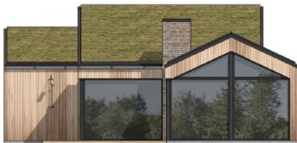
facade mod vest