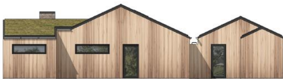
facade mod syd