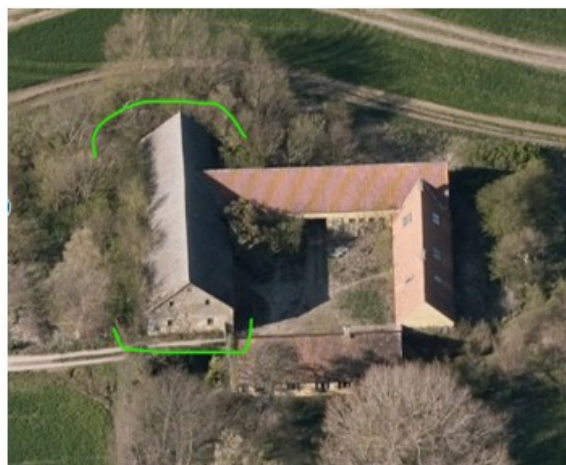
Vestlængen markeret med grøn