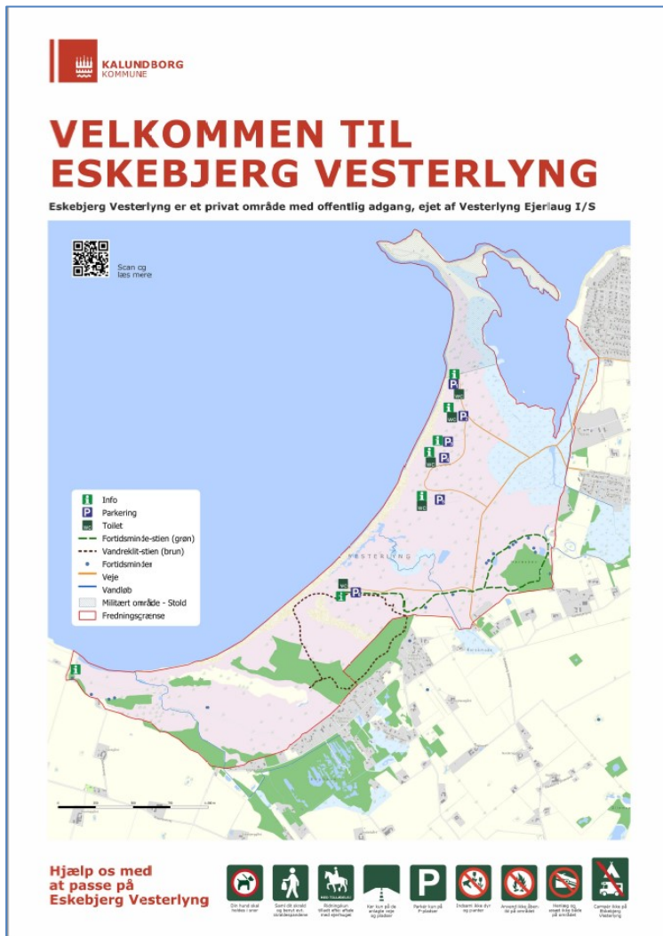
Fig. 2. Velkomstskiltet, format 90 x 120 cm, der ønskes placeret ved indfaldsvejene til området, hvoraf én placering er inden for strandbeskyttelseslinjen.

Sagen er i efteråret 2023 blevet drøftet med ejerlauget (lynglauget) og behandlet af Fredningsnævnet for Vestsjælland, der i en afgørelse af 24. september 2023 meddeler dispensation fra landskabsfredningen (afgørelse FN-VSJ-043-2023) til projektet. I forbindelse med fredningsafgørelsen afholdes der et åstedsmøde med deltagelse af bl.a. Danmarks Naturfredningsforening, hvor placeringen af skiltene justeres på enkelte placeringer. Det betyder bl.a. at et af velkomstskiltene flyttes uden for fredningen – og strandbeskyttelseslinjen.