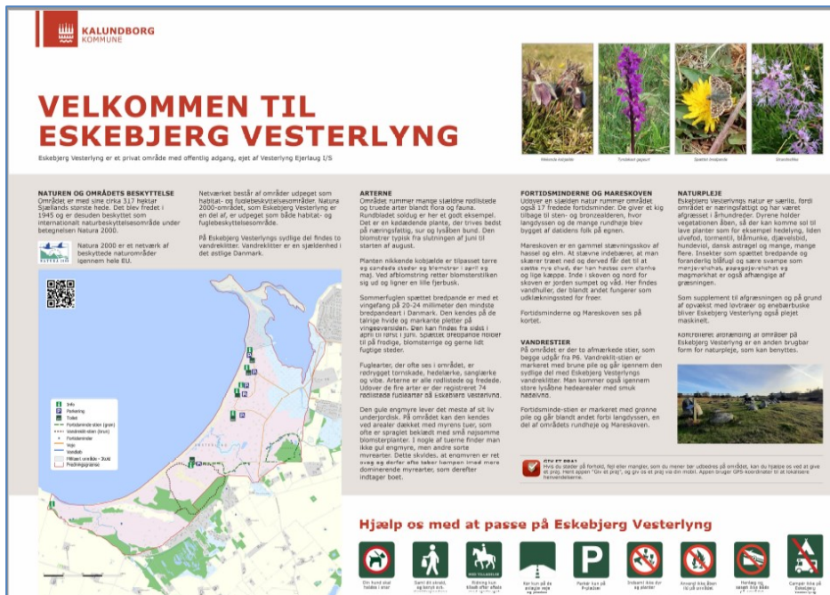
Fig. 3 Informationstavle, format 120 x 90 cm, som ønskes placeret ved hver af områdets 7 P-pladser, der alle er inden for strandbeskyttelseslinjen. Tavlerne ønskes anbragt, så gæsterne møder dem, når de forlader P-pladsen på vej mod stranden.