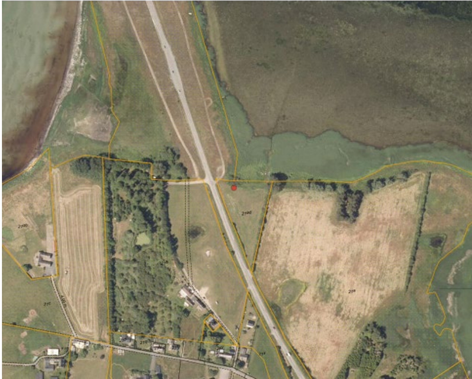
Fig. 2. Ortofoto 2024. Campen er markeret med rød prik. Det strandbeskyttede areal er markeret med orange signatur. De umatrikulerede arealer ud til kysten samt stranden er dog også omfattet af bestemmelserne om strandbeskyttelse. De sorte streger markerer de vejledende matrikelskel og ligger flere steder samme sted som afgrænsningen af strandbeskyttelse.