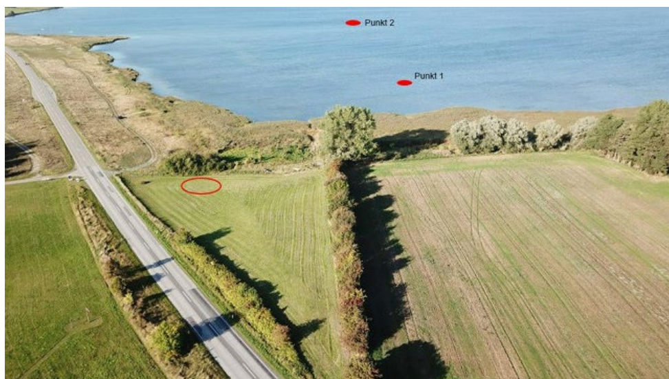
Fig. 1. Forslag til placering af Campen (indsendt af ansøger).

Fig. 2. viser placering af Campen i forhold til strandbeskyttelseslinjen.