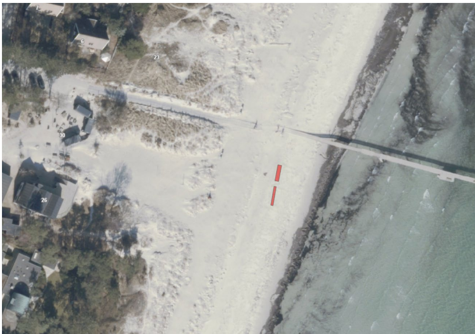
Kortudsnit indsat fra ansøgningen viser placering af pavilonerne

Opsætning og nedtagning af pavilloner sker samme dag som arrangementets afholdelse.