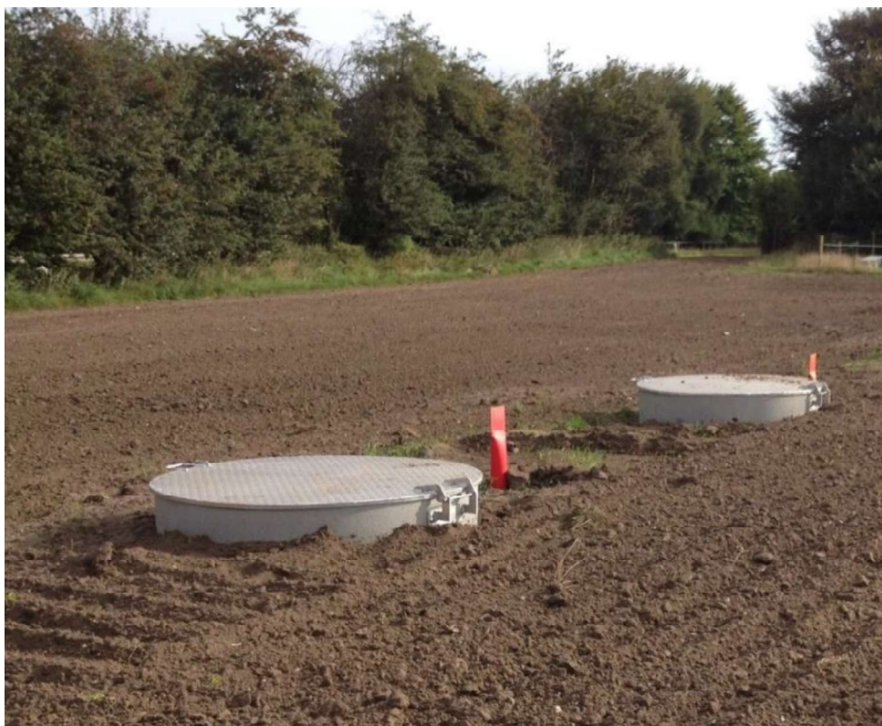
Eksempelfoto af linkbokse i terræn