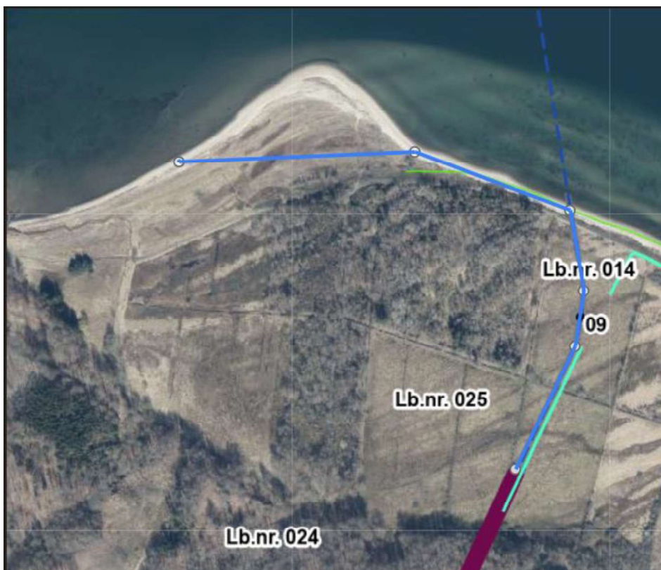
Figur viser med blå streg omtrent, hvor ansøger ønsker at oplagre rørene på stranden.

Det er ifølge ansøger afklaret med lodsejer (Naturstyrelsen) at Energinet kan benytte arealet umiddelbart vest for søkablet til projektet.