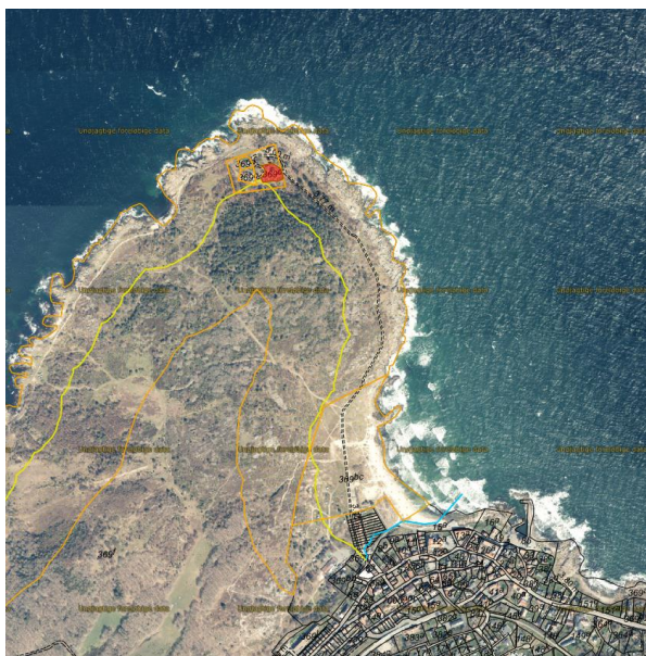
Fig. 1. Ortofoto fra foråret 2025. Den gule linje markerer den oprindelige 100-meter-strandbeskyttelseslinje, mens den orange linje markerer den udvidede 300-meter-strandbeskyttelseslinje. Det strandbeskyttede areal er markeret med orange prikker. De sorte streger markerer de vejledende matrikelskel. Den ansøgte matrikel er markeret med rød.

På vegne af ejerne af Hammer Odde Fyr 2, Sandvig, 3770 Allinge, indsendes hermed forespørgsel og evt. ansøgning om dispensation til at genetablere en skorsten på deres ejendom. Ejendommen har i dag ingen skorstene, men man ønsker at genetablere den skorsten som sidder mod øst eller til højre på det vedhæftede billede. Den sad nemlig midt på tagryggen. Det er en helt almindelig Bornholmerskorststen de gerne vil etablere, se vedhæftede om etablering af skorstene på Bornholm. Vi er i tvivl om genetableringen af skorsten kræver dispensation for strandbyggelinjen. Hvis det gør, skal dette ses som en ansøgning om dispensation.