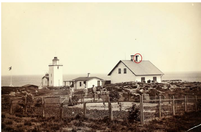
Fig. 2. Gammelt foto af ejendommen indsendt af ansøger. Den tidligere skorsten på taget, som nu igen ønskes opført på tagryggen, er markeret med rød cirkel.