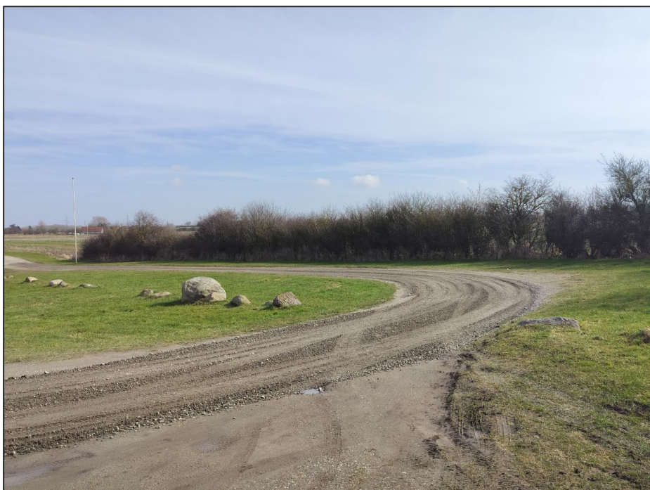
Fig.5. Tilsendt af ansøger. Foto af den ansøgte placering fra vest.