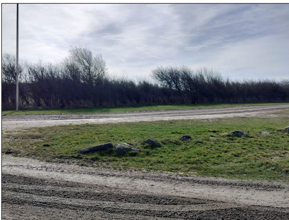
Fig.4. Tilsendt af ansøger. Foto af den ansøgte placering fra nord.