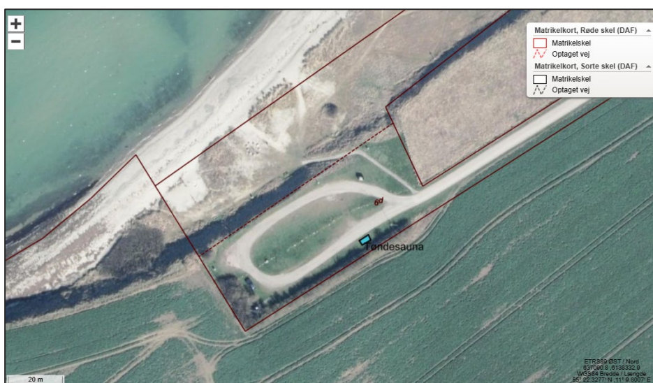
Fig. 2. Ortofoto 2025. Den lyseblå polygon markerer den ansøgte placering. De røde streger markerer de vejledende matrikelkæder.