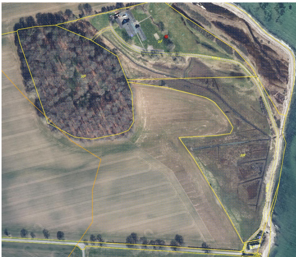
Fig. 1. Ortofoto 2023. Det orangeprykkede område markerer det strandbeskyttede areal. De gule streger markerer de vejledende matrikelskel.