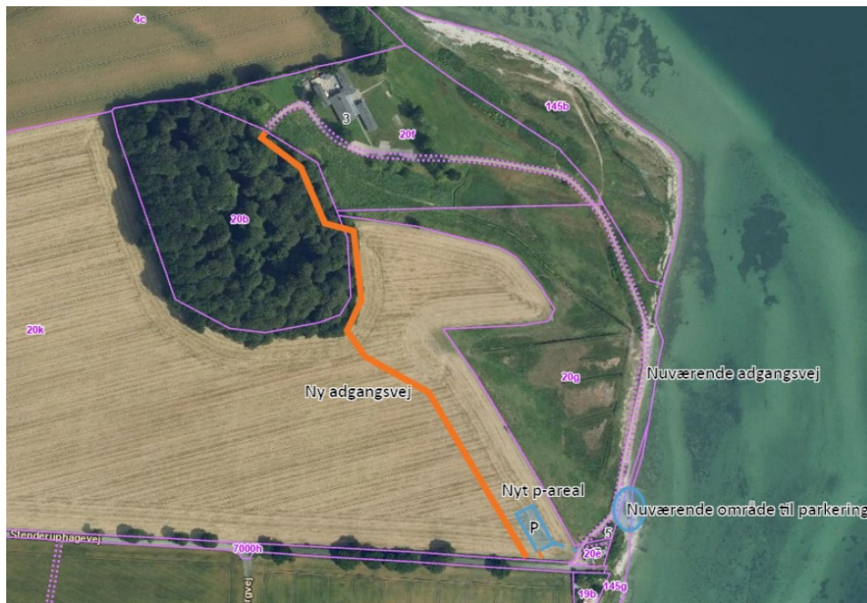
Illustration fra ansøgningsmaterialet. Placering af ny adgangsvvej og nyt parkeringsareal.

udlægges og komprimeres ca. 25 cm knust beton. Den afrømmede muld udjævnes i et tyndt lag på østsiden af vejen, som i øvrigt følger det naturlige terræn.”