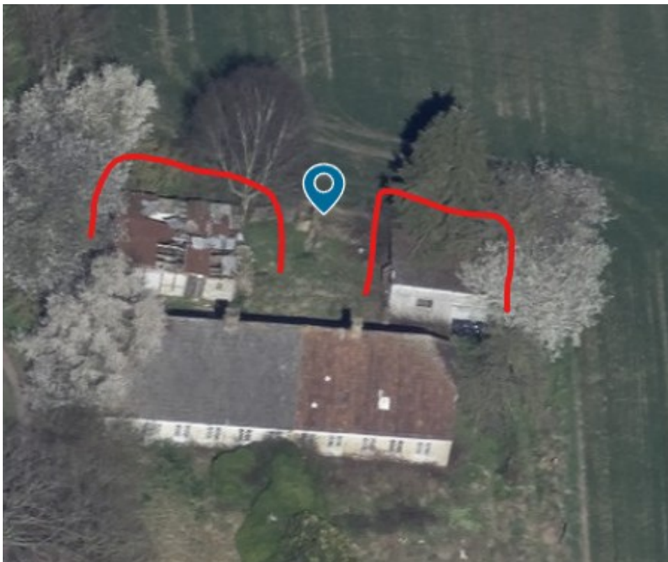
Ejendommen 2024. De to udhuse markeret rød. Nyt udhus/carport placeres hvor venstre udhus ligger.

Ansøger ønsker endvidere at opføre terrasseareal omkring boligen mod syd og øst, samt at placere en flagstang i grundens sydøst hjørne.