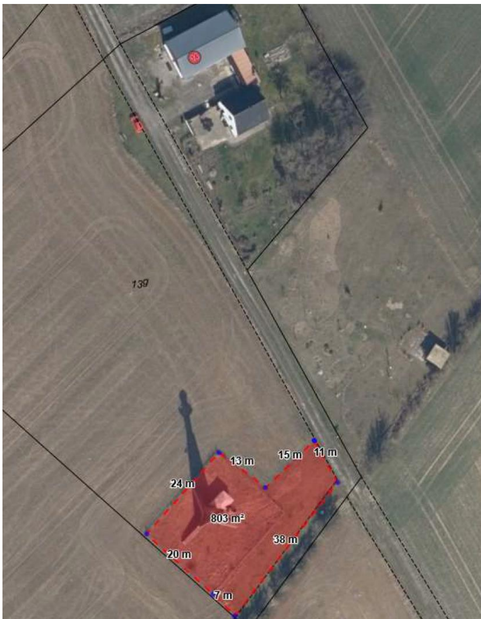
Fra ansøgningsmaterialet. Udstykningsforslag.