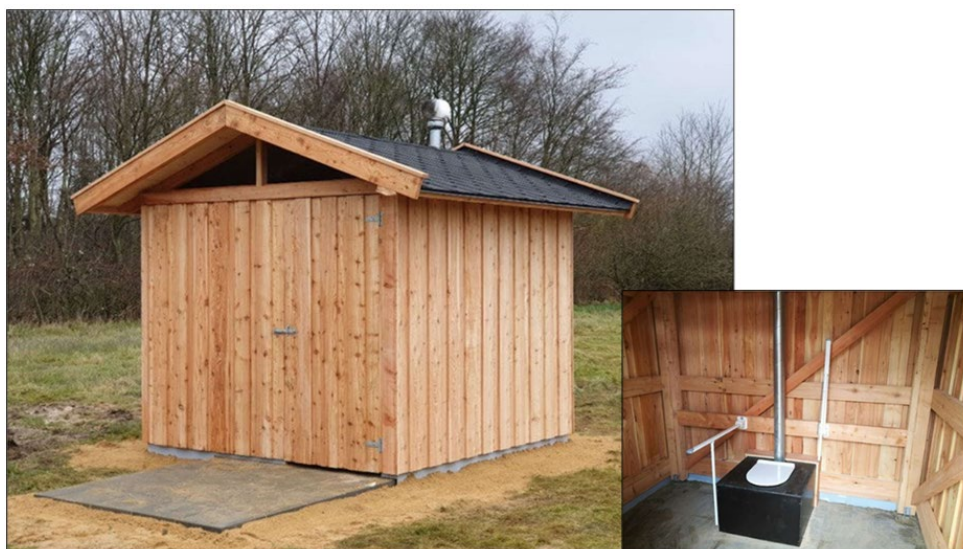
Fig. 3. Tilsendt fra ansøger. Billeder af et tilsvarende muldtoilet som det ansøgte.