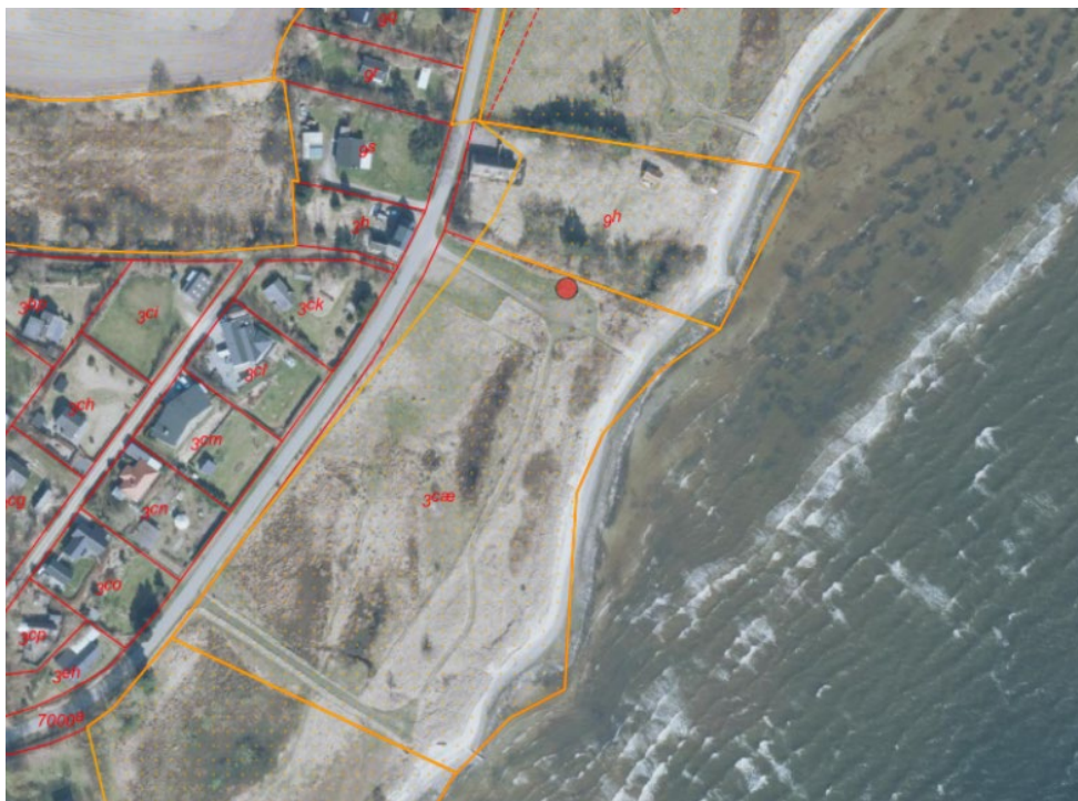
Fig. 1. Ortofoto 2025. Det strandbeskyttede areal er markeret med orange signatur. De røde streger markerer de vejledende matrikelskel. Den røde prik markerer den ansøgte placering af muldtoiletet.

Toiletbygningen måler 2,75 x 2,75 meter (L x B).