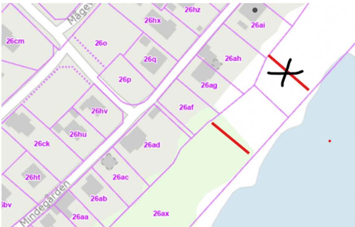
Fig. 2. Kort over ønskede flytning af trappe, fra Matr. nr. 26ai og 26o til Matr. nr. 26af og 26ax. Kort vedlagt ansøgningen.

Derfor håber jeg, at vi kan få Jeres tilladelse til at flytte og genopbygge den manglende trappe, iht. Lokalplanen, på Matr.nr. 26af og 26xa, snarest det er Jer muligt.[...]"