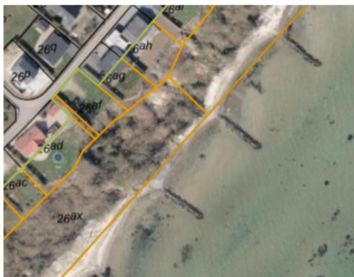
Fig. 1. Ortofoto 2025. Det strandbeskyttede areal er markeret med orange signatur. De sorte streger markerer de vejledende matrikelskel. Den gule streg markerer den oprindelige 100-meter strandbeskyttelseslinje.

Begge matrikler er ubebyggede og beliggende indenfor strandbeskyttelseslinjen i deres helhed.