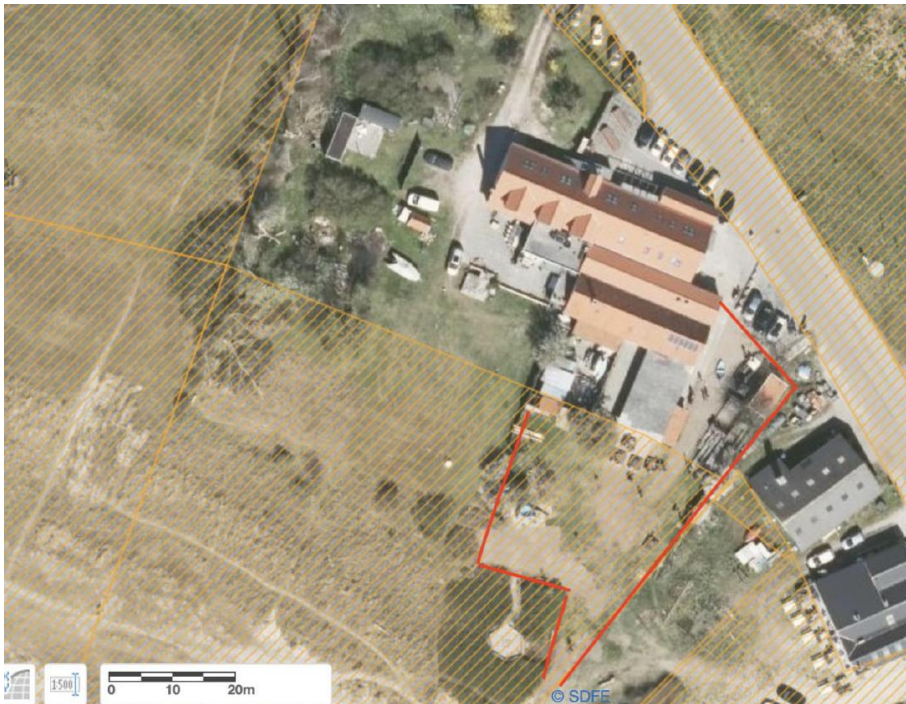
Figur 2: Luftfoto med indtegning af det areal, der indhegnes i forbindelse med koncerterne (røde streger). Hegnet står på blokke lagt direkte på jorden. Højden er 200 cm. Orange skravering angiver strandbeskyttede arealer.