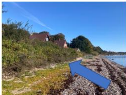
Set fra sydvest