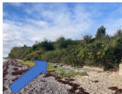
Set fra nordøst