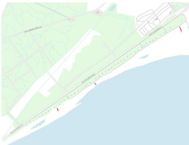
Sommerhusenes placering langs kysten (ubebyggede felter markeret rød)

Hertil kommer, at Kystdirektoratet finder, at der ikke er kystlandskabelige interesser eller forhold, som taler imod. Direktoratet lægger herved vægt på, at sommerhusene på de 50 byggefelter fremtræder som en sammenhængende og sluttet bebyggelsesstruktur, der fremtræder mere harmonisk og slutte end hvis bebyggelserne lå ujævnt og sporadisk fordelt langs kysten inden for det naturligt afgrænsede område, hvor parcellerne ligger.