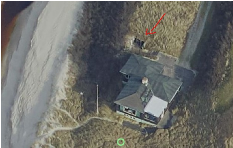
Luftfoto 2020 over og 1999 under