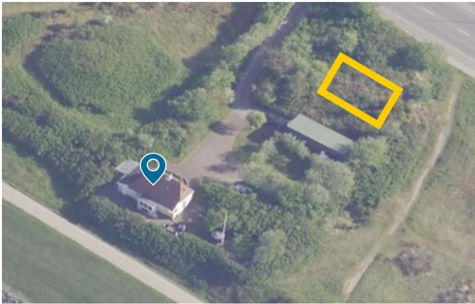
Figur indsendt af ansøger viser placering af den nye garage.