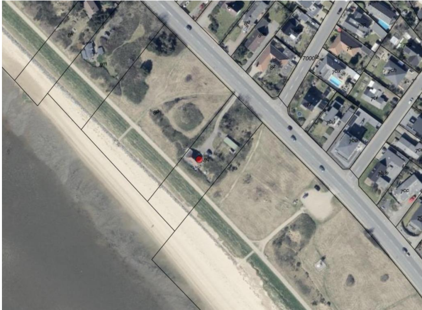
Luftfoto af området. Sommerhuset er markeret med rød prik