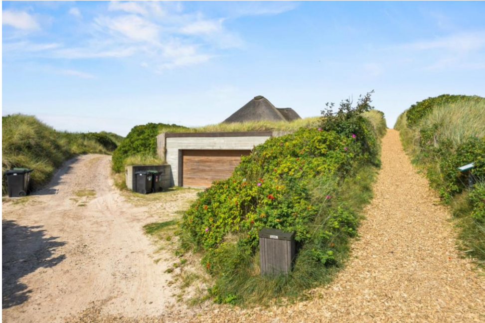
Foto af tilsvarende løsning indsendt af ansøger.