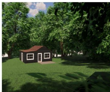
Visualisering fremtidig bygning Version 2 - Uden stemkant + hvide vinduesindfatninger