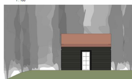
Vestfacade 1 : 100