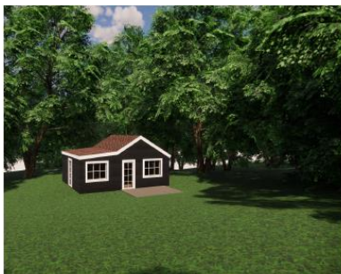
Visualisering fremtidig bygning Version 1 - Hvid stemkant + hvide vinduesindfatninger

Huset opføres med samme form som eksisterende, dog med ændret tag idet der ønskes tegl. Ansøger har endvidere fremlagt 3 forslag til udformning af facaden som vist nedenfor.