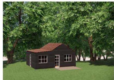
Visualisering fremtidig bygning Version 3 - Uden stemkant og vinduesindfatninger

Visualisering af mulige facader – under: eksisterende bygning