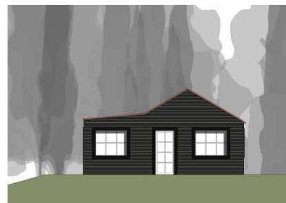
Sydfacade 1 : 100