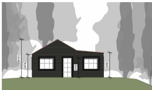
Nordfacade 1 : 100