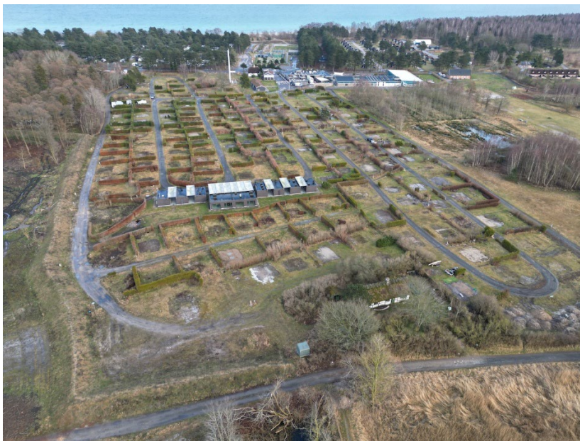
Foto af tidligere forhold set fra vest. Indsendt af ansøger.

Asfalt er desuden en mere robust løsning, der bedre modstår den daglige trafik uden at skabe huller og efterfølgende behov for reparationer med grus.