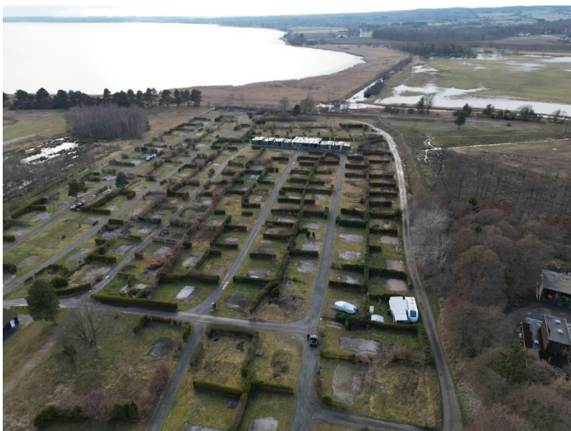
Foto af tidligere forhold set fra øst. Indsendt af ansøger.