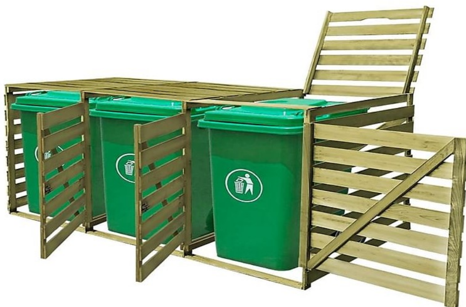
Fig. 2. Eksempel på udseende af den ansøgte affaldsstation.

Nordfyns Kommune beskriver valg af placering af affaldsstation således: