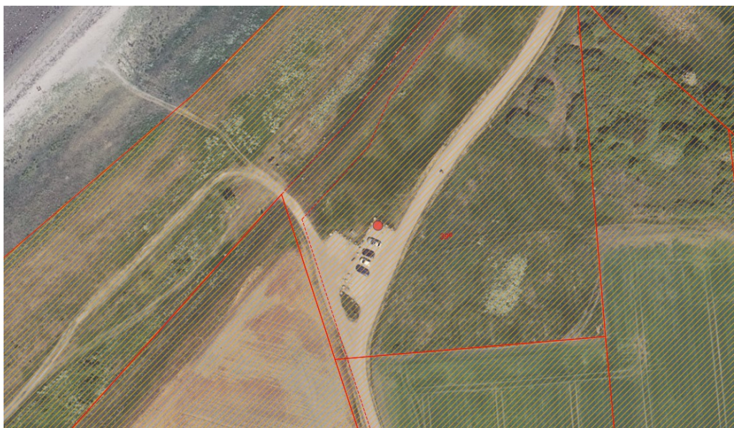
Fig. 3. Ortofoto 2020. Det orange skraverede område markerer det strandbeskyttede areal. De umatrikulerede arealer ud til kysten samt stranden er dog også omfattet af bestemmelserne om strandbeskyttelse. De røde streger markerer de vejledende matrikelskel. Den røde prik markerer den ansøgte placering af affaldsstationen.

Alle de steder, som lever op til affaldsbekendtgørelsen om at være tæt på sommerhusene, er underlagt kystbeskyttelse – både vest og øst for sommerhusene. Pladsen på Donnervej er det sted, hvor vi vil komme til at ændre mindst muligt i naturen ved at have skraldespande stående, og de vil også kunne betjene badegæster og fjerne tung trafik fra området. For os er denne placering oplagt, og slår mange fluer med et smæk.”