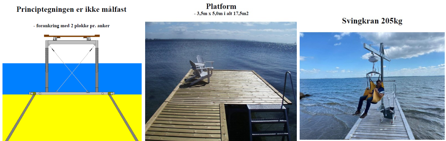
Fig. 3. Snittegning af badebroens opbygning, samt referencefoto af tilsvarende badebro med brohoved og referencefoto af svingkran.

Udover at være en sædvanlig offentlig badebro, vil der med handicapindretningerne kunne opnås understøttende muligheder i forbindelse med ROFI-centrets genoptræningshold.