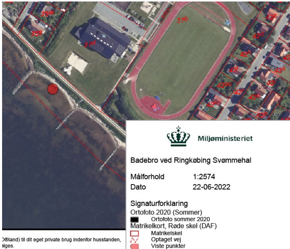
Fig. 2. Anlæggets placering

Anlægget etableres ved matr. 2hq, Ringkøbing Markjorder ud for Kongevejen 52a, 6950 Ringkøbing.