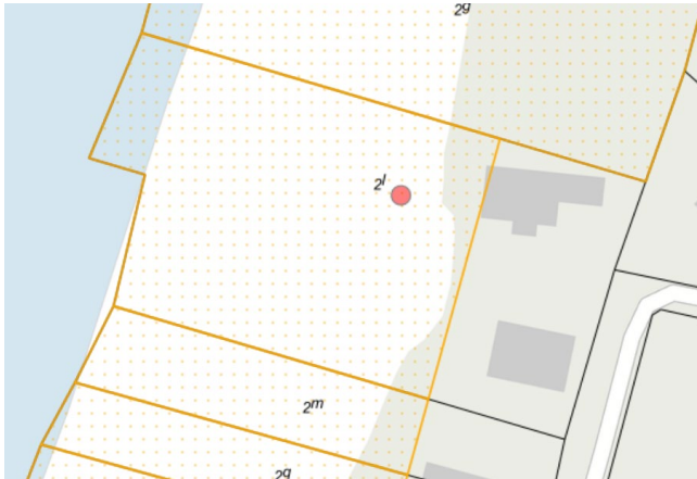
Fig. 1. Skærmkort over matriklen. Det strandbeskyttede areal er markeret med orange signatur. De sorte streger markerer de vejledende matrikelskel. Den røde prik markerer den ansøgte trappes placering.

Ejendommen er i BBR noteret som et sommerhus opført i 1934. Ejendommen er beliggende i et sommerhusområde, og matriklen er delvis omfattet af den reducerede strandbeskyttelseslinje, hvor selve sommerhuset er beliggende uden for strandbeskyttelseslinjen. Dette betyder, at matriklen er omfattet af den oprindelige strandbeskyttelseslinje, som trådte i kraft i 1937, se figur 1 og 2.