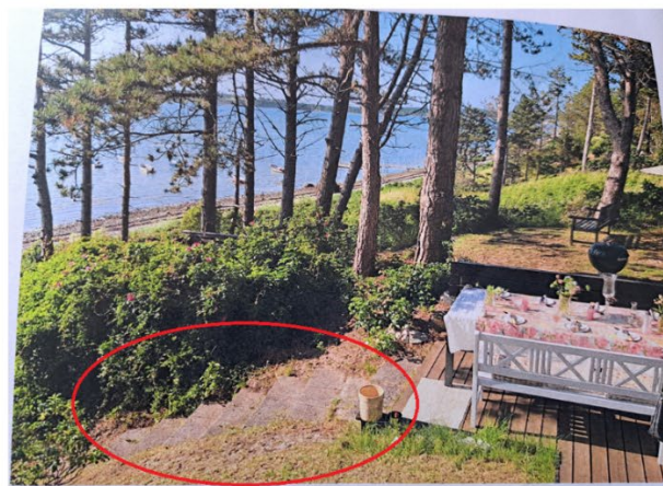
Fig. 3. Billeder af det tidligere trappeforløb, inden etableringen af trætrappe. De røde cirkler markerer trappetrin. Det præcise årstal for billedernes oprindelse er usikker, men estimeret til omkring år 2000.

Baggrunden for Kystdirektoratets positive indstilling overfor en 'mindre trappe' er, at Kystdirektoratet anerkender, at der historisk har været et stiforløb ned over skrænten samt at Kystdirektoratet ikke kan afvise at der har været en mindre trappe på dele af stiforløbet. Figur 4 viser et historisk luftfoto af stiforløbet.