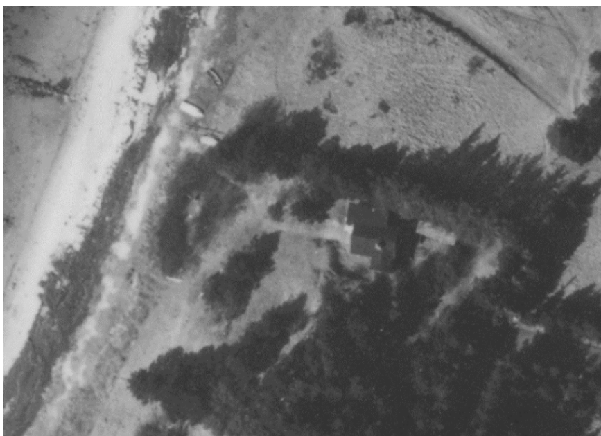
Fig. 4. Luftfoto fra 1975, hvor der ses et stiforløb fra huset og ned over skrænten.

Baggrunden for Kystdirektoratets positive indstilling overfor en 'mindre trappe' er, at Kystdirektoratet anerkender, at der historisk har været et stiforløb ned over skrænten samt at Kystdirektoratet ikke kan afvise at der har været en mindre trappe på dele af stiforløbet. Figur 4 viser et historisk luftfoto af stiforløbet.