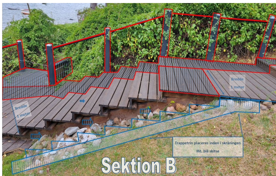
Fig. 6. Illustration af den midterste del af trappen (sektion B), indsendt af ansøger. De røde markeringer viser de elementer der fjernes. De blå markeringer viser den ansøgte trappes forløb.