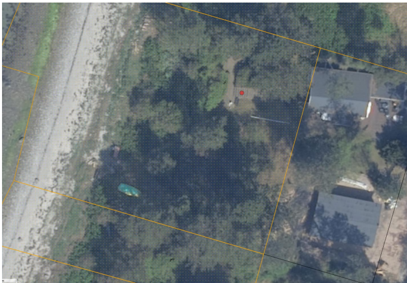
Fig. 2. Ortofoto 2024. Det orange prikkede område markerer det strandbeskyttede areal. De sorte streger markerer de vejledende matrikelskel. Den røde prik markerer trappens placering.