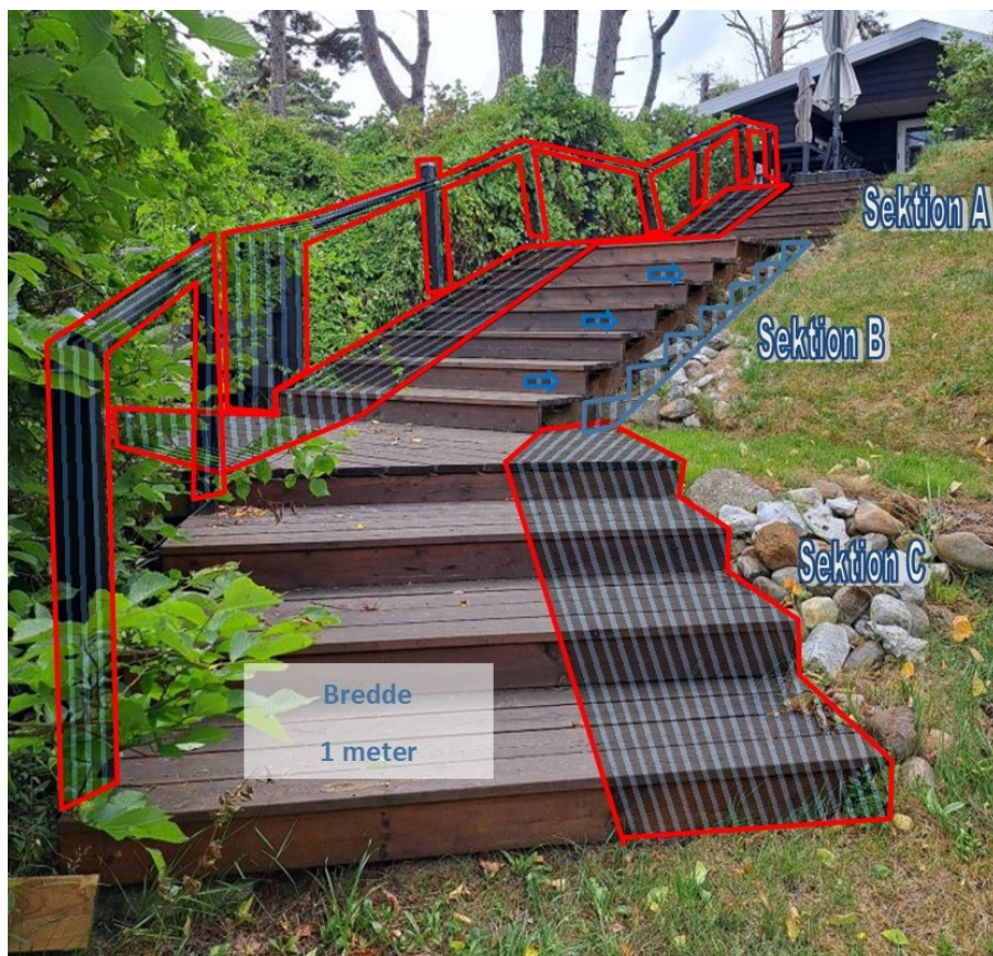
Fig. 7. Illustration af den nederste del af trappen (sektion C) med sektion A og B i baggrunden, indsendt af ansøger. De røde markeringer viser de elementer der fjernes. De blå markeringer viser den ansøgte trappes forløb.