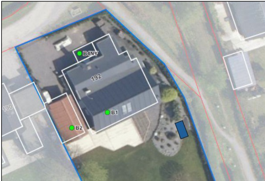
Fig. 2. Tilsendt af ansøger. Den ansøgte placering er markeret med blå polygon.