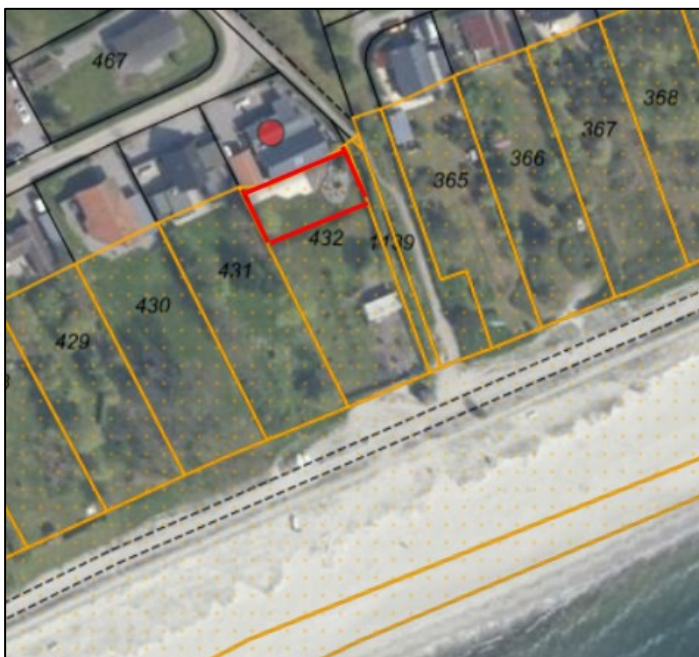
Fig. 3. Ortofoto 2024. Kort fra afgørelse i sagsnr. 2025-65800. De røde streger markerer den omtrentlige udstrækning af den lovligt etablerede have inden for strandbeskyttelseslinjen, jf. § 15a, stk. 4. Den røde prik markerer huset. Det orange prikkede område markerer det strandbeskyttede areal. De sorte streger markerer de vejledende matrikelskel.