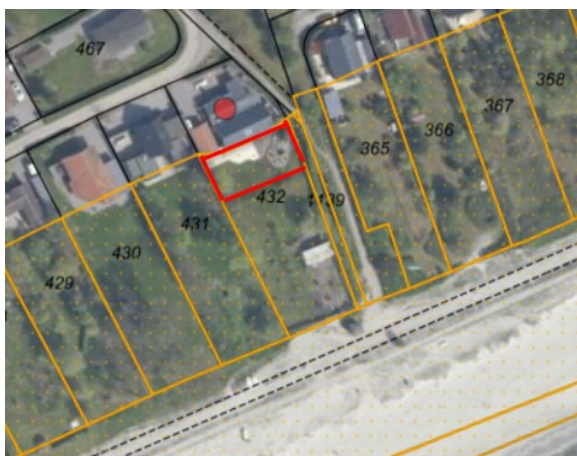
Fig. 4. Ortofoto 2024. De røde streger markerer den omtrentlige udstrækning af den lovligt etablerede have inden for strandbeskyttelseslinjen, jf. § 15a, stk. 4. Den røde prik markerer huset. Det orange prikkede område markerer det strandbeskyttede areal (de umatrikulerede arealer ud til kysten er dog også omfattet af bestemmelserne om strandbeskyttelse). De sorte streger markerer de vejledende matrikelskel.

Kystdirektoratet har efter en gennemgang af de tilgængelige luftfotos (bilag 4) vurderet, at en del af det strandbeskyttede areal kan betragtes som en lovlig etableret have. Figur 4 viser arealet, som Kystdirektoratet vurderer som værende en lovlig etableret have.