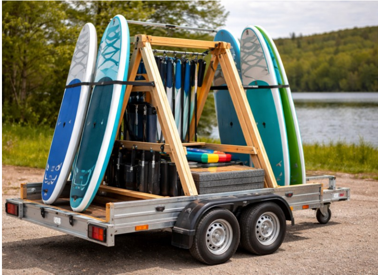
Figur 2. Billede fra ansøgningen af den mobil trailer.