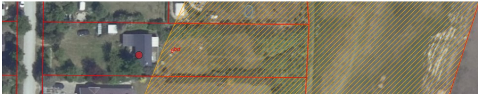
Fig. 1. Ortofoto 2020. Det orange skraverede område markerer det strandbeskyttede areal. De røde streger markerer de vejledende matrikelskel.

Ejendommen er en sommerhusejendom, hvor sommerhuset er beliggende uden for strandbeskyttelseslinje. Der er inden for strandbeskyttelseslinjen anlagt en lovlig have.