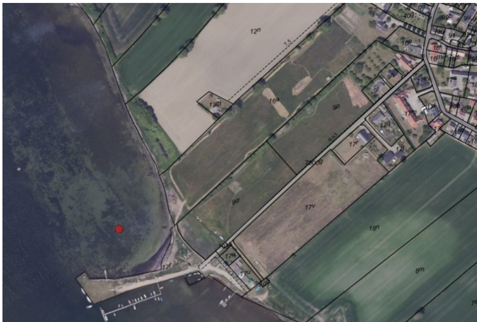
Luftfoto af området indsat fra SagsGIS.

Projektområdet grænser op til Vildreservatet Sydfynske Øhav. Inden for reservatet er det ikke tilladt at færdes i visse områder mellem 1. marts og 15. juli.