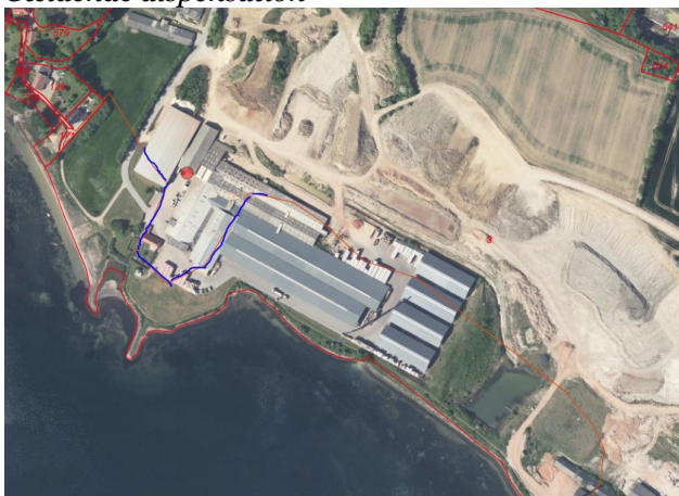
Tilbygningen placeres ved rød prik