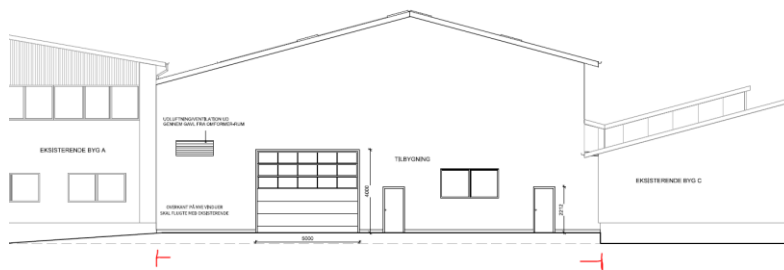
Ændret og ansøgt udformning- tilbygningen markeret med rød

Der ansøges om at øge bygningens rummelighed ved at ændre tværsnittet så taget føres helt hen til en tilgrænsende bygning jf. nedenstående. Tilbygningens bebyggede areal ændres ikke.