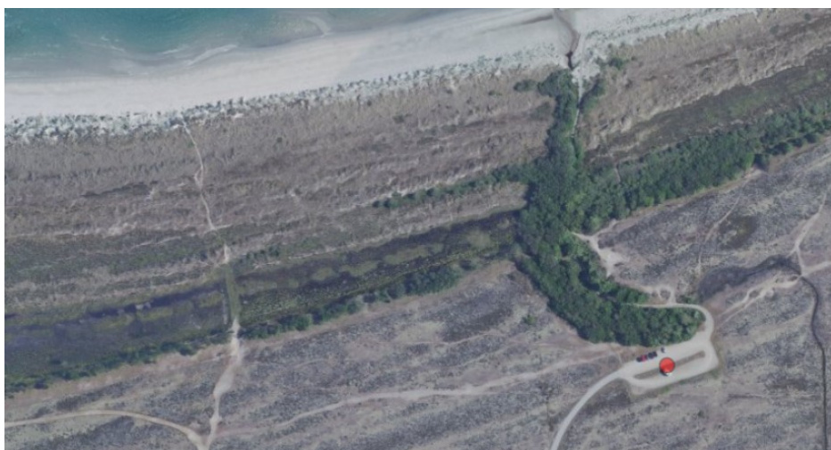
Luftfoto af projektområdet. Parkeringspladsen er markeret med en rød prik.