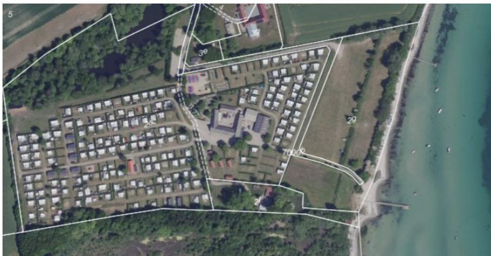
Luftfoto af området. Indsat fra SagsGIS.

Der søges om at afholde en koncert d. 22. juli 2021 på ovennævnte matrikel, der ligger mellem Kongshøj Strand Camping og havet. Der opstilles en scene som på situationsplanen nedenfor. Der forventes op mod ca. 400 gæster til arrangementet. Vest for scenen og publikumsarealet kan der parkeres. Arealet bruges efter det oplyste også til dagligt til parkering for gæster ved stranden.