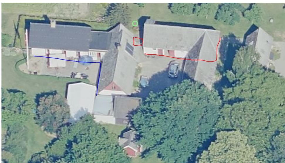
Eksisterende bolig markeret med blå – mellemgang og udvidelsen med rød