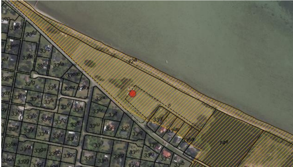
Fig. 1. Ortofoto 2020. Den røde prik markerer placering af fitnessredskaberne. Det orange skraverede område markerer det strandbeskyttede areal. De sorte streger markerer de vejledende matrikelskel.

Askø Strandvig Grundejerforening har ansøgt om at opsætte fitnessredskaber i forbindelse med en eksisterende legeplads på grundejerforeningens fællesområde (se fig. 1).