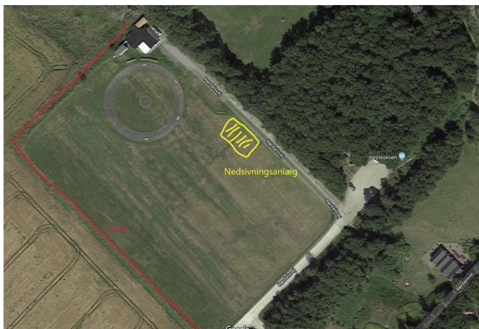
Fig.2 Billede fra ansøgningen, der viser den ønskede placering af nedsivningsanlægget.

Ejendommen er beliggende i skovbyggelinje og området er registreret som bevaringsværdige landskaber. Derudover er der på ejendommen også registreret fund og fortidsminder af anlægstype "Flyvestation".