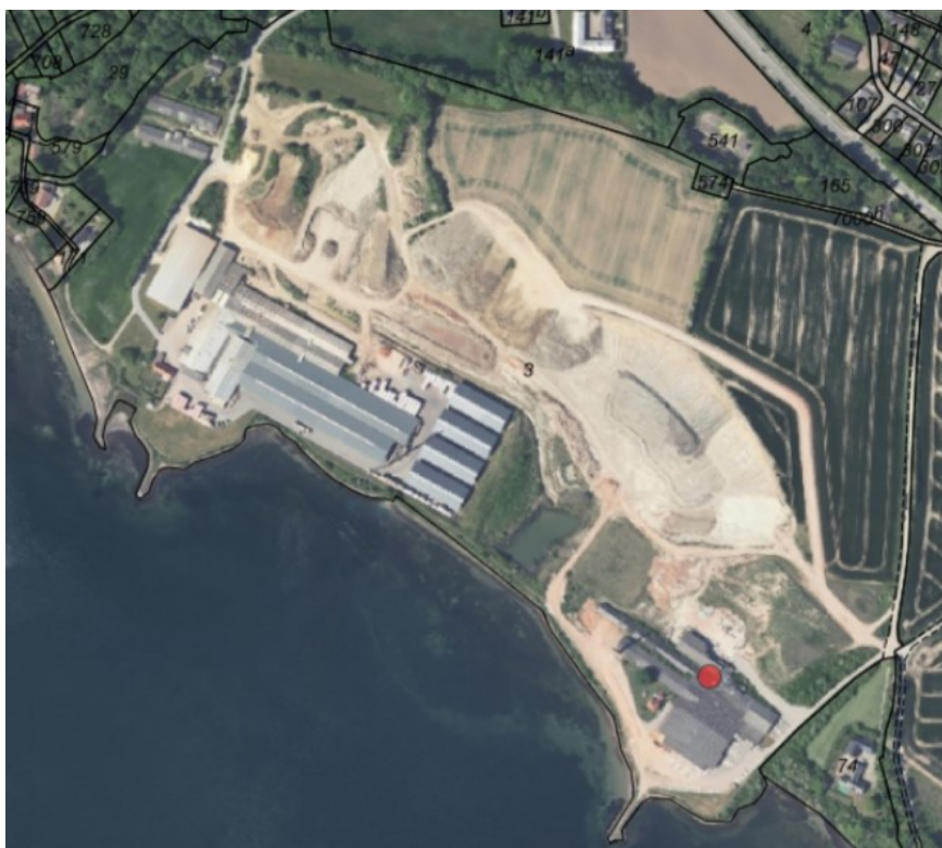
Luftfoto af teglværket indsat fra SagsGIS. Ansøgningen vedrører arealet omkring de bygninger, der ses mod sydøst (markeret med rød prik).

Langs skråningstoppen mod Nybøl Nor ligger Nybøl Stien, som efter aftale med Sønderborg Kommune friholdes.