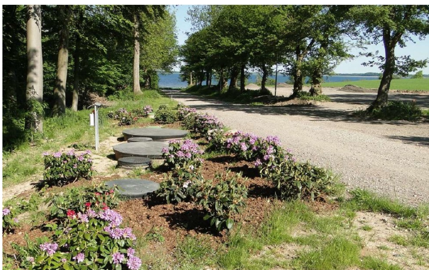
Synlige dele af tilsvarende anlæg, dog med mindre dæksler

Det Classenske Fideicommis betragter etableringen af de 2 brønde som en del af den nødvendige drift af ejendommen.