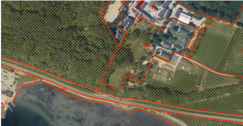
Figur 1. Ortofoto 2020. Det orange skraverede område markerer det strandbeskyttede areal. De røde streger markerer de vejledende matrikelskel.

Du har den 25 februar 2021 fremsendt en ansøgning om dispensation til at opstille fire glampingtelte i parken til Kalø Højskole i en periode på seks uger, fra og med uge 26 og seks uger frem. Teltene skal opstilles i forbindelse med sommerophold på højskolen, og skal lejes ud i forbindelse med afholdelse af opholdene.