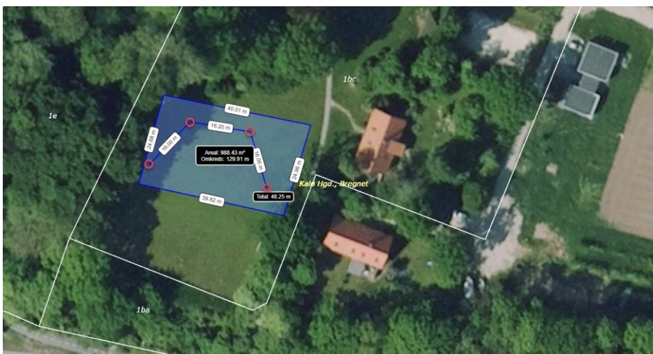
Figur 2, kortbilag fra ansøgningen, der viser arealet teltene opstilles på

Af ansøgningen fremgår, at teltene opsættes på et 1.000 m 2 stort areal, på en måde så de ikke tager udsyn/indsigt til og fra skolen. Teltene opstilles i højskolens park. Af ansøgningen fremgår videre, at hvis et af teltene skal omplaceres på grund af vind, vejr eller lignende, kan det ske uden for området, men teltene holder sig inden for et areal på 1.000 m 2 .