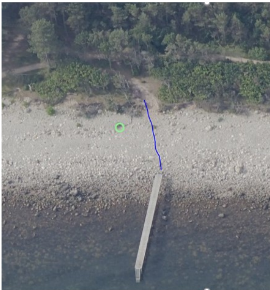
Markering af tracéen