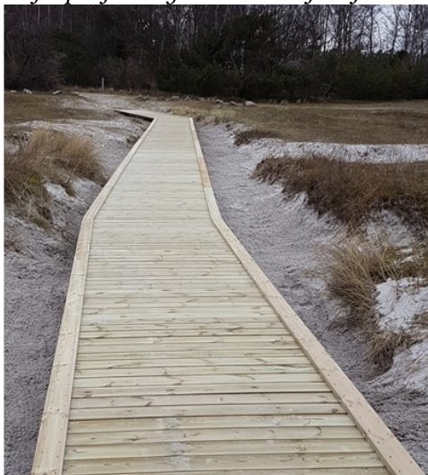
Træfortov svarende til det ansøgte