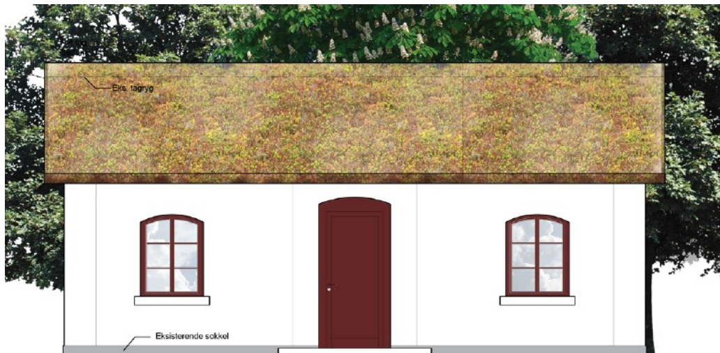
Facade mod gårdsplads – taget er sedum-tag